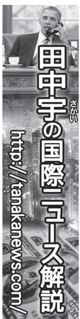
田中宇の国際ニュース解説

「お願ひ 世界を窮地に追い込んでいる新型コロナウィルスに よる社会活動の制約を受けて、邦字紙も印刷版を停 止し電子版の配送のみとなりました。また、当俳壇へ の投稿者も多くは旬会活動を通して作品をお寄せに 下さつていますが、今や殆どどの旬会が中止となり 加えて地方によっては郵便局も閉鎖され、投稿が著し く減少しております。 場合によっては印刷版の発行が再開されるまでのし ばらくの間、投稿状態を見て俳壇の休止を考えた と思ひます。不可抗力とは言えども残念なことです。 この際皆様には、しっかりと鋭気を養って再開の日に 備えておいて下さるようお願い致します。」