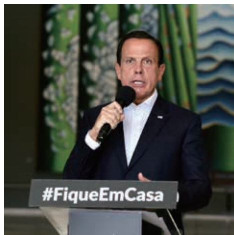
外出自粛令延長を発表するジョアン・ドリャ聖州知事(GOVESP)

【既報関連】新型コロナウイルス感染症(COVID-19)の感染者は増え続けており、8日午後5時すぎの保健省発表では、感染者1万5927人、死者800人となった。感染者の最も多い州は、州内でも最も多い州で外出自粛令が4月22日まで延長されたが、市内では、周辺地域を中心に外出自粛令が守られなくなっていることを示す光景が見受けられた。また、聖州と並び感染者数の多いリオ州のフアヴェーラも状況は変わらないと、8日付G1サイトが報じた。