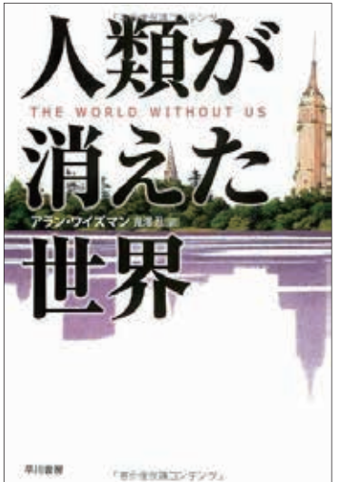
『人類が消えた世界』(アラン・ワイスマン著、丸山隆男訳、2008年)

「人類が消えた世界」のテーマは、「今の環境破壊がそのまま続く」と終にはジオ・カタストロフイ(Ceo-catastro-Phie)「地球の破局」が起る。正確に言えば、人類が滅ぶことはあっても、地球が滅ぶことはない。