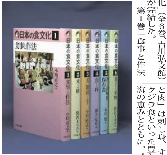
「日本の食文化」全6巻 (共同)

【共同】日本人は何を、何のために、どのように食べてきたのか。民俗学をはじめ、歴史学や家学など多様な視点から編まれた「日本の食文化」(全6巻、吉川弘文館)が完結した。