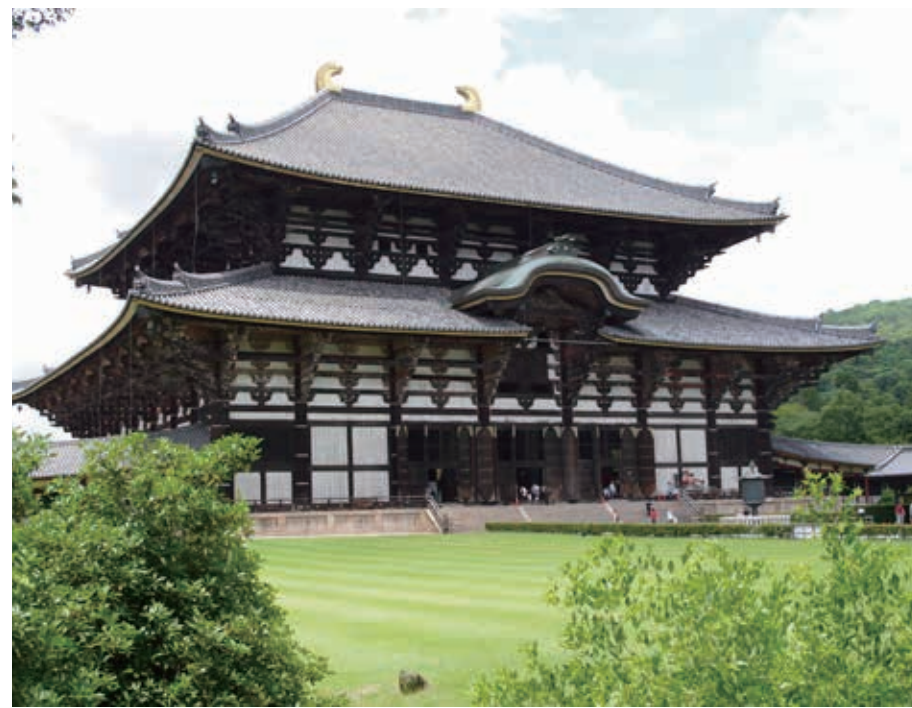
735年から737年にかけて奈良時代の日本で発生した天然痘の流行は、「天平の疫病大流行」と呼ばれる。東大寺大仏殿、盧舎那仏像(奈良の大仏)は、この天平の疫病大流行の後に聖武天皇の命によって建立された

「人類が消えた世界」のテーマは、「今の環境破壊がそのまま続く」と終にはジオ・カタストロフイ(Ceo-catastro-Phie)「地球の破局」が起る。正確に言えば、人類が滅ぶことはあっても、地球が滅ぶことはない。