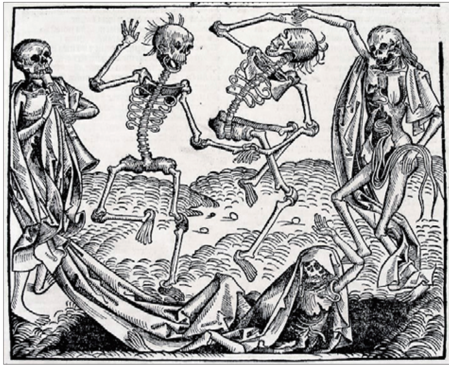
ミヒャエル・ヴォルゲムート(ドイツ語版)『死の舞踏』1493年、版画「生」に対して圧倒的勝利をかちとった「死」が踊っているすがた。14世紀の「黒死病」の流行は全ヨーロッパに死の恐怖を引き起こした

「人類が消えた世界」のテーマは、「今の環境破壊がそのまま続く」と終にはジオ・カタストロフイ(Ceo-catastro-Phie)「地球の破局」が起る。正確に言えば、人類が滅ぶことはあっても、地球が滅ぶことはない。