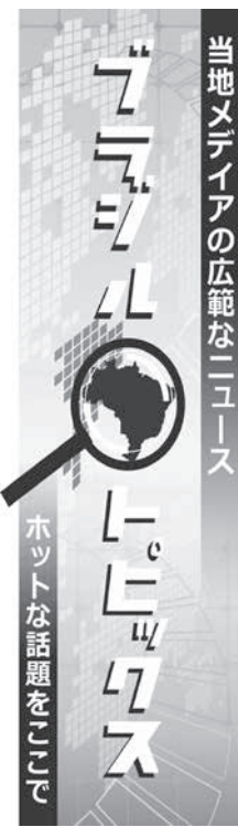
ホットな話題をピックアップ

【既報関連】子供の犠牲者は少ないとされる新型コロナウイルス感染症だが、国内最年少となる3カ月の犠牲者が出た。