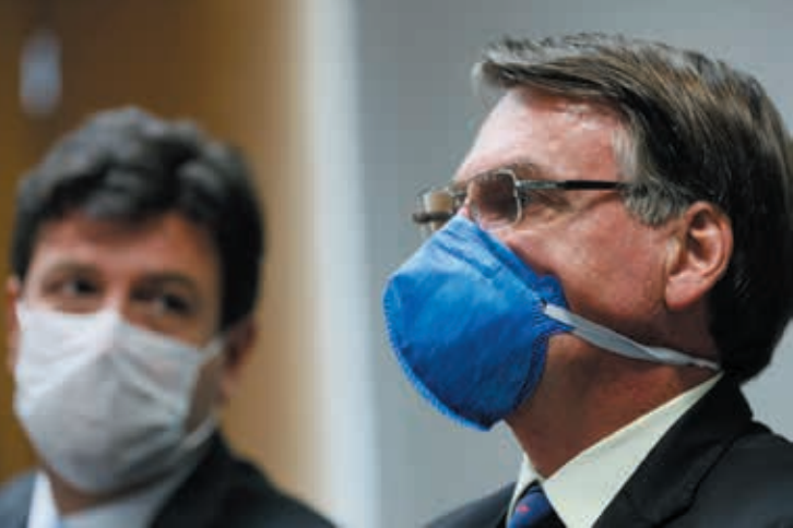
ボウソナロ大統領(右)

「辞めるべきではない」が59%、「分らない」が4%だった。法定最低賃金の5〜10倍の月収で69%が辞任に反対しており、法定最低賃金の2〜5倍の月収でも、64%が辞任に反対だった。