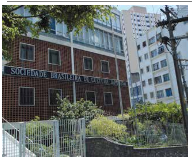
ブラジル日本文化福祉協会の前景

新型コロナウイルス(Covid-19)のパンデミックという新たな課題に人類が直面しているこの時期において、ニッケイ新聞社による「連帯メッセジリ」の呼びかけ、および、ホームページでの情報無償提供の決定は、我々日系社会にとつて大変心強いものであると、心からの感謝と支持を表明致します。