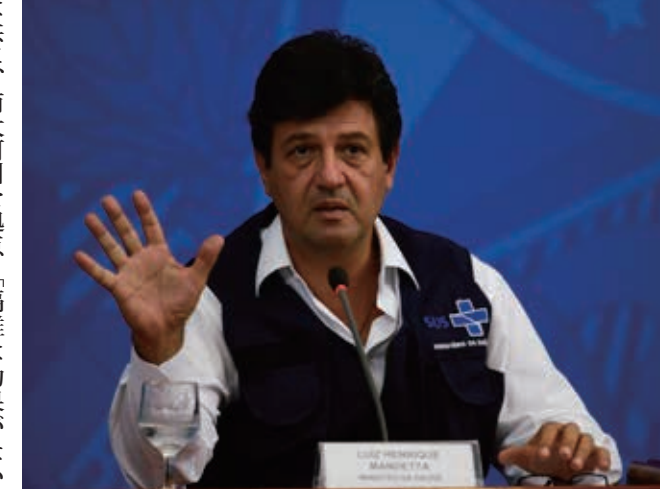
マンデッタ保健相

「回復したある程度の免疫は得られるというのが世界中の研究者の大方の見解だが、その免疫がどれほど期間有効かも分かっていない」とした。