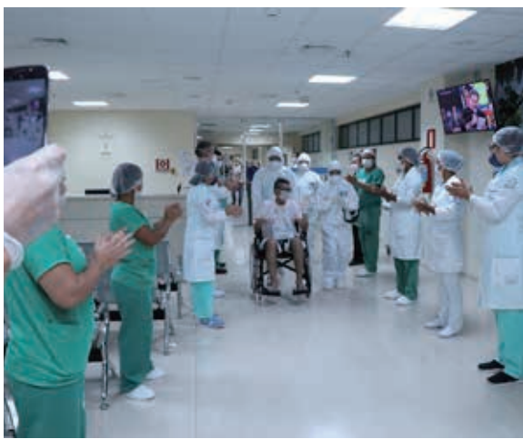
新型コロナウイルス感染症から回復し退院する人

【既報関連】伯国保健省は15日午後4時過ぎの定例会見で、新型コロナウイルス感染者2万8320人、死者1736人と発表した。また、前日14日には回復者の公式人数の発表も始めた。15日付伯国サイプレスが報じている。