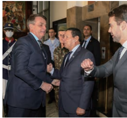
4月30日のポウソノ大統領

4月29日に起きた、最高裁によるアレシヤンドレ・ラマジエム氏の連邦警察長官就任差し止めに対し、同氏の就任に固執するポウソノ大統領が、4月30日にアレシヤンドレ・ラマジエム氏に就任を命じた最高裁に、4月28日付の紙、サイトに報じている。