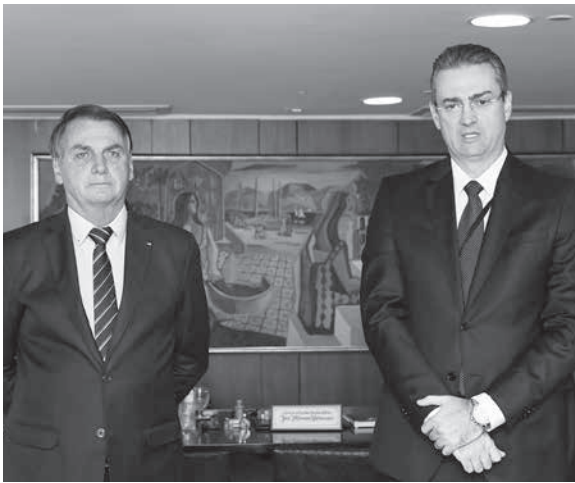
ローランド氏(右)とボウソナロ大統領

4日、ボウソナロ大統領は連邦警察新長官にローランド・デ・ソウザ氏を指名。1時間後に就任式も行った。一方で、セルジオ・モロ前法相が、自身が辞任する決め手となった。大統領の連警への介入行為と見なす証拠を含む、パラナ州連邦警察で行った供述の公開を最高裁に求め、4、5日付付字紙、サイトが報じている。