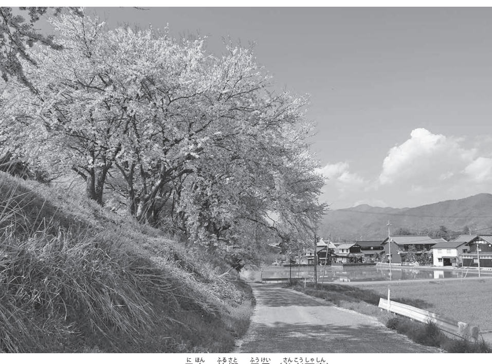
日本の故郷の風景 (参考写真)