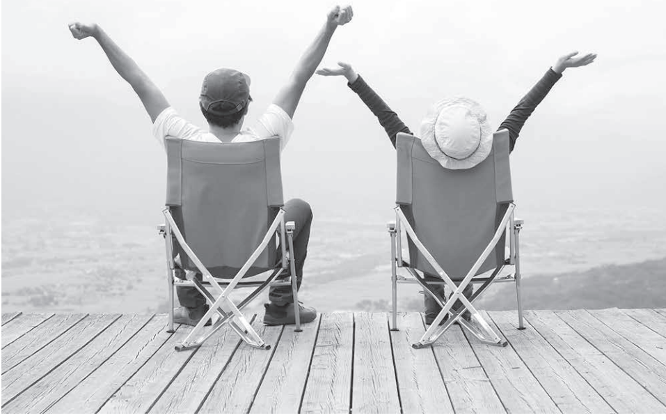
適度な距離を保っている二人の姿 (参考写真)

「人間距離」は「じんかんきょり」と読む。「人間」は「じんかん」と読む。「距離」は「きょり」と読む。「人間」は「じんかん」と読む。「人間」は「じんかん」と読む。