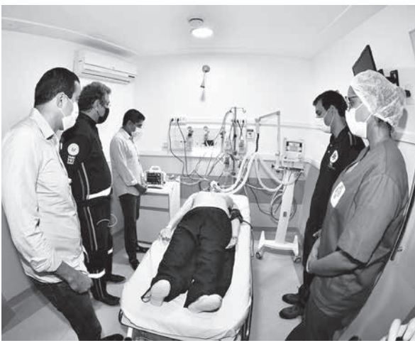
国内各地で臨時病院が建てられている (参考画像・Max Haack/Secom)

保健局発表で68.9%だった。大聖州に限ると86.9%だ。コロナウイルスで亡くなる人は、60歳以上の高齢者に多いが、20代や30代、赤ん坊でも犠牲