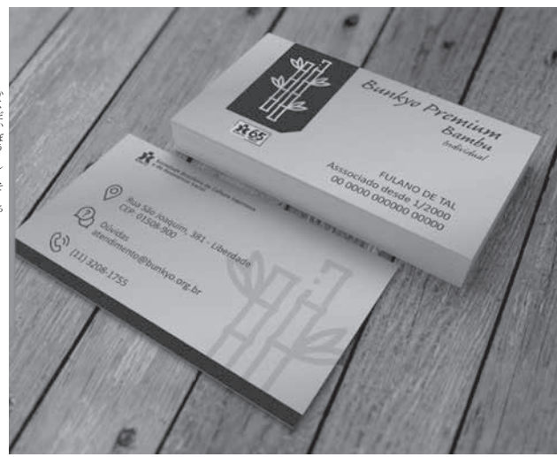
文協プレミアムの会員カード

新型コロナウイルス(Covid-19)による未曾有の事態の中、ブラジル日本文化福祉協会(石川レナト会長)はコロナ対策を本格化させるために危機管理委員会を立ち上げた。また、会員に向けての新しい取り組みとして会員特典制度「文協プレミアム」を4月から開始した。