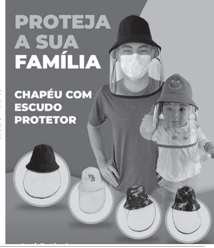
PROTEJA A SUA FAMÍLIA CHAPÉU COM ESCUDO PROTETOR