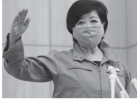
東京の質問に答える都知事小池百合子

【共同】東京都は2日、新型コロナウイルスの感染者が新たに34人報告されたと発表した。夜の繁華街や既に感染者が出ている病院を中心に感染拡大の兆しがみられる。小池百合子都知事は同日夜の対策本部会議で、警戒を呼び掛ける「東京アラート」を初めて出した。午後11時に都庁舎と東京湾に架かるレインボーブリッジを赤く点灯、30人以上となるのは5月14日以来19日ぶり。都によると、2日までの1週間で判明した新規感染者計114人のうち、夜の繁華街が感染源とみられるのは32人で3割近くを占める。小池氏は休業要請緩和に関する3段階のロードマップで、劇場や映画館、学習塾やスポーツジムなど1日から移行した「ステップ2」の段階は維持する方針。会議では「必要