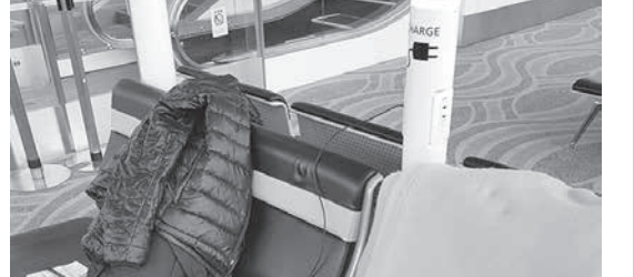
洗わないアペノ毛布

(4)LINEアプリ等を活用した健康確認、個人情報取り扱いの同意書、説明書兼同意書