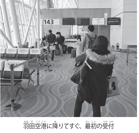
羽田空港に降りてすぐ、最初の受付