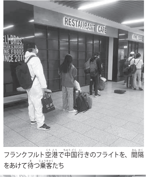
フライト前空港で中国行きのフライトを、間隔をあけて待つ乗客たち