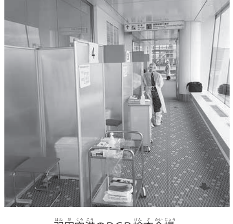
羽田空港のPCR検査会場

(2)申告書(待機場所までの移動手段、滞在期間、待機場所、連絡先など)を記入する。滞留期間、滞在場所、連絡先など、申告書に記入する。