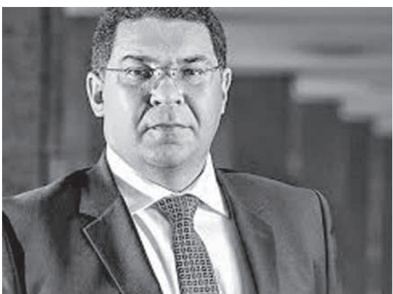
マンエスト・アルメイダ国庫財務局長

マンエスト・アルメイダ国庫財務局長は、1千億(1000億)レアルを突破する恐れはないと述べ、プレカトリアの延期が最悪を免れる一因となった。4月は、税金の納入期が先送りや金融取引税の減免により、44.7%増となった。