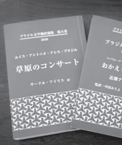
「おかえりなさい」と「草原のコンサート」の表紙

協ビル内で開催し、ほぼ満員の約1100人が入場して有識者の講演に耳を傾けた。 日系文学会が翻訳本2冊刊行 3年掛りの歴史ロマンスと短編集