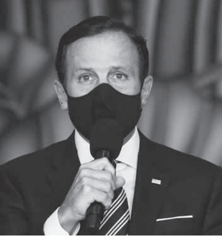
外出規制の見直しなどを発表する聖州のドリア知事(GOVESP)

の模範としたウエーデンはコロナ対策での失敗を認め、米国のトランプ大統領は「ボウソナロ大統領と同じ方針を採っていない」として、100万250万人の感染拡大が、内陸部に広がりつつある事に注目に値する。コロナの感染拡大が進み、8日現在の死者総計が全国の80%にあたる2万9122人に達した。124市の動向を分析したFarol Covidによる、5月末、6月初旬の感染拡大の速度が速い方から上位10市中、7市はパラ州内陸部にあり、感染速度が未だに大きい市で、最初の感染者確認は3月末、4月だ。また、124市中、感染速度が減速中の上位10市中、5市は州都だ。これら10市中、各感染者からの感染率が1人未満なのはポルト・アレグレだけだが、同市も死者のピークはまだで、感染終息には時間を要す。