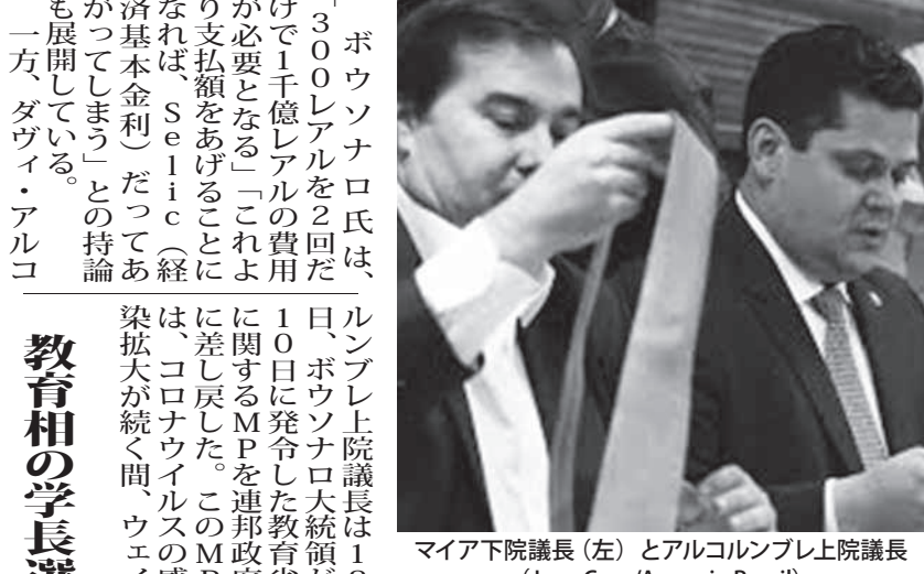
マイア下院議長(左)とアルコロンブレ上院議長