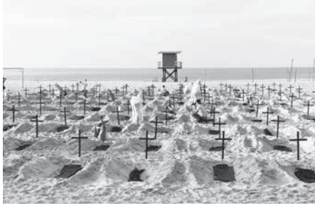
コバカパーナ海岸に掘られた穴と十字架