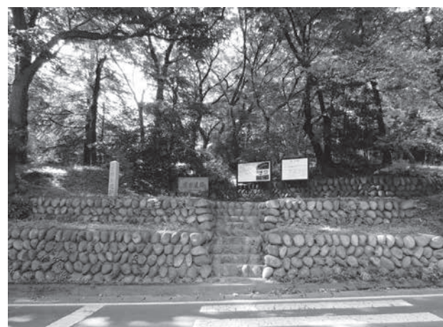
史跡・岩宿遺跡

01 日本人は何処からきたか 人類は約700万年、猿人と呼ばれる最古の人類がアフリカ大陸で誕生し、二足歩行し、あいた両手で石器を使用したと言われている。約240万年前には、サビエンスは生物学で種 原人が登場し、火を使い毛皮をまとって寒冷なヨーロッパやアジアへ進出していったが、絶滅したと考えられる。約20万年前、現代人の直接の祖先である新人(ホモ・サビエンス)がアフリカで誕生した。ホモ・サビエンスは生物学で種