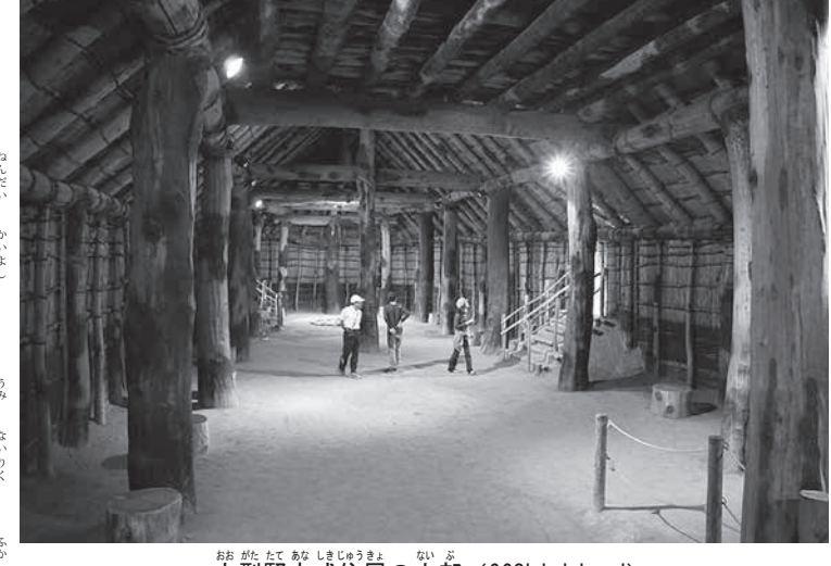
大型竪穴式住居の内部

仕事をしない日は博物館に行つて、こつこつと考古学を学びました。そして「いつから日本人は日本に住んでいるのか」を知ろうとしました。 戦争が終つた1946年、群馬県桐生市に移り、遺跡の発掘を始めました。笠懸村の切通しに、東口1層の地層が露出した。産出しない黒曜石の石片を数点発見し、旧石器文化の痕跡について確か