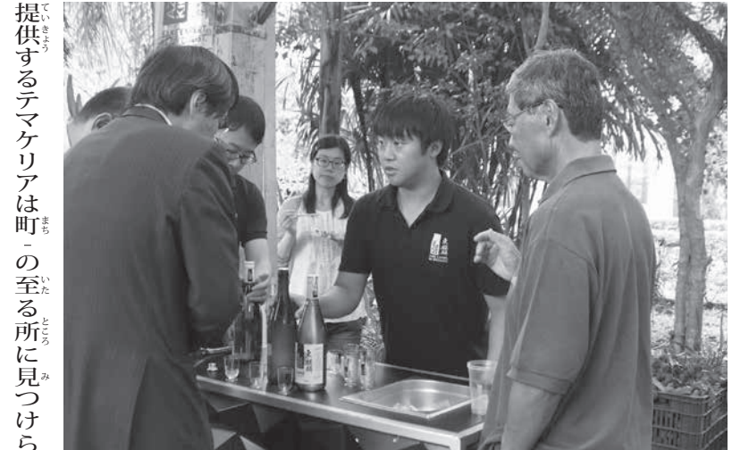
東山農場でのイベントにて吟醸酒の説明を行う様子

また現場とその感覚を共有する。ある程度は浸透してはいるが、実際に来てみると想像以上に伯国文化のなかに日本文化が見え、とても驚いた。伯国には日本人移民が多いため、手巻き寿司を例えれば、手巻き寿司を