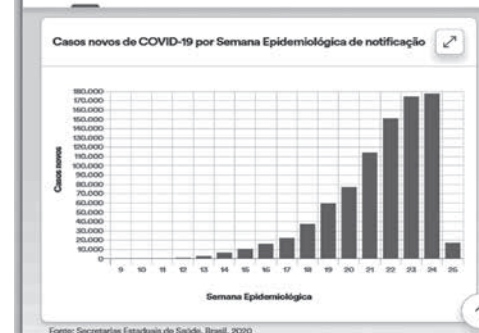
感染者数の推移を示すグラフ

40%超だった週間の死者増加率も、第23週が31.0%で、以下、24.6%、18.9%と続いている。週単位で見ると、感染者増加率が前週を上回った州数は、第23週10、第24週3である事も、感染拡大の減速を示すといえる。第22週(5月24・30日)の週単位の感染者増加率が最低だったベルナンブコ州(24.8%)、ナンブコ州(24.8%)、17.8%、13.5%と、第23週が20.3%