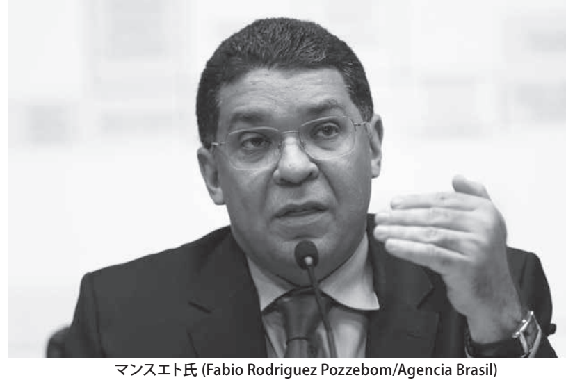
マンスエト氏

の増加は感染者の増加より遅れる傾向が確認されるが、前週比の死者増加率が10%台の州数は第21週に1つ、徐々には増加し、24週には7州だった。州都マナウスでの感染がピークを越え、臨時病院閉鎖も発表された。死者増加率が第23週9%、第24週10.4%で最小。第24週の最大のマツ・グロソンの100%で、セルジッペの90.4%が続く。感染者数の増加はドラ