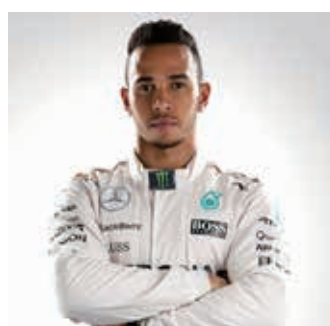
O inglês Lewis Hamilton é o piloto mais bem pago da F-1.

Hamilton, Vettel e Ricciardo estão entre os esportistas mais bem pagos do mundo. A Forbes divulgou a lista anual de atletas mais bem pagos do mundo, com destaque para Neymar Jr, na 4ª posição.