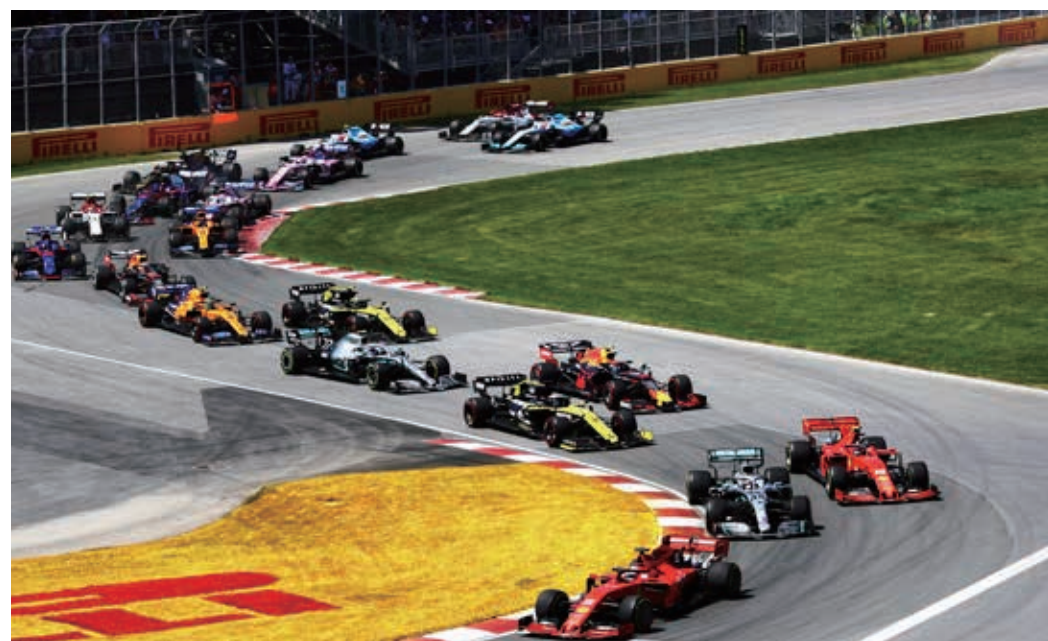
Campeonato da F-1 em 2020 começa no dia 5 de julho com o GP da Áustria, sem público nas arquibancadas.

A Fórmula-1 divulgou que o campeonato deste ano começa no dia 5 de julho com o GP da Áustria, sem público nas arquibancadas.