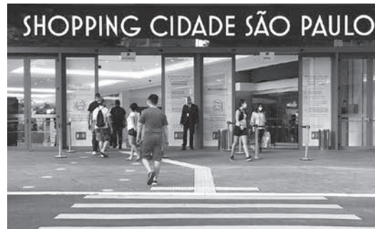
SHOPPING CIDADE SÃO PAULO