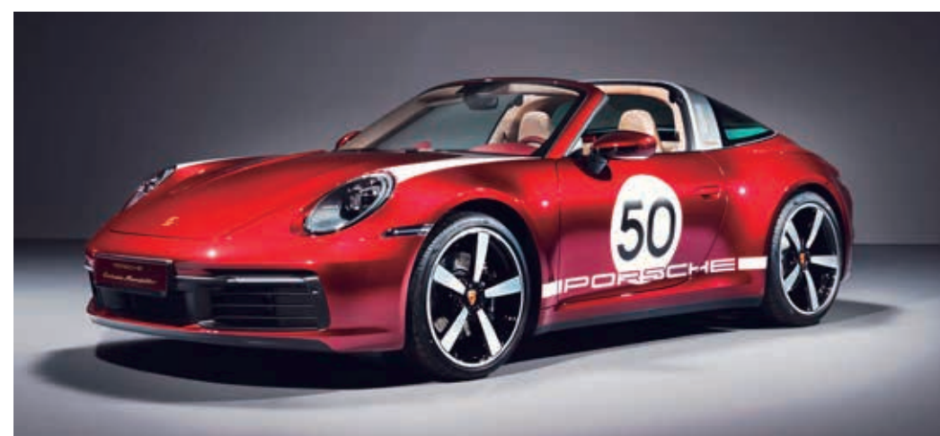
Rodas Carrera Exclusive Design de série com 20 e 21 polegadas. Ainda não há confirmação se o modelo estará disponível para venda no Brasil.

コレクターモデルは、992 台のみの限定販売で、 ブラジルでの価格はまだ確認されていない