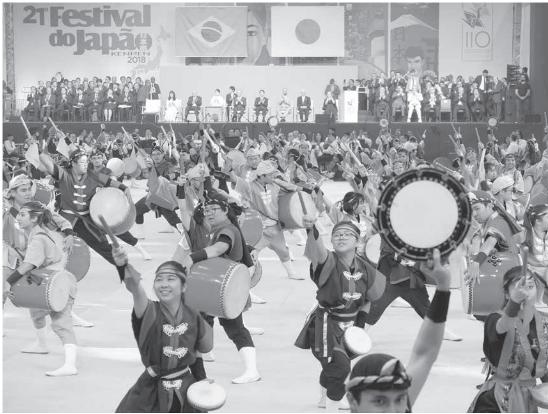
眞子さまをお迎えして異国日本祭り特設会場で開催されたブラジル日本移民110周年式典の様子。200周年でもこのように盛大に開催できるか？

少し気が早い話だが、もしも在外邦人にも給付金10万円が出た場合、その使い道について提案したいことがある。 共同通信は10日付で「在外邦人に10万円給付検討」政府、自民の意見考慮と報じた。 政府は10日、新型コロナウイルスの感染拡大を受け、緊急経済対策として1人10万円の「特別定額給付金」について、海外在留邦人も対象にできないか検討に入った。複数の関係者が明らかにした。現在は4月27日時点で住民基本