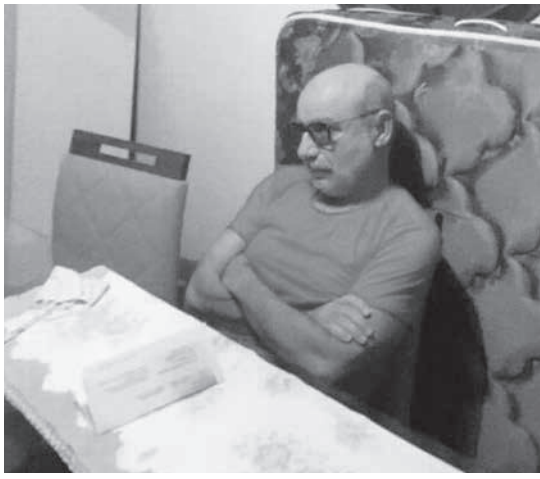
逮捕当時のケイロス氏 (twitter)