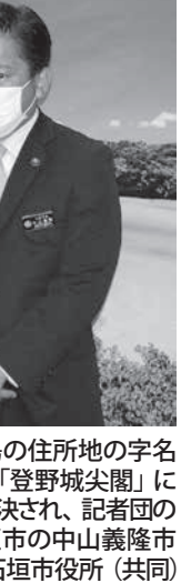
石垣市議会議員の中山義隆氏(共同)

【共同】石垣市行政区域に「尖閣」の文字を入れることで、石垣島市街地の地名「登野城」に変更する議案が、石垣市議会(共同)で22日午後、石垣市役所