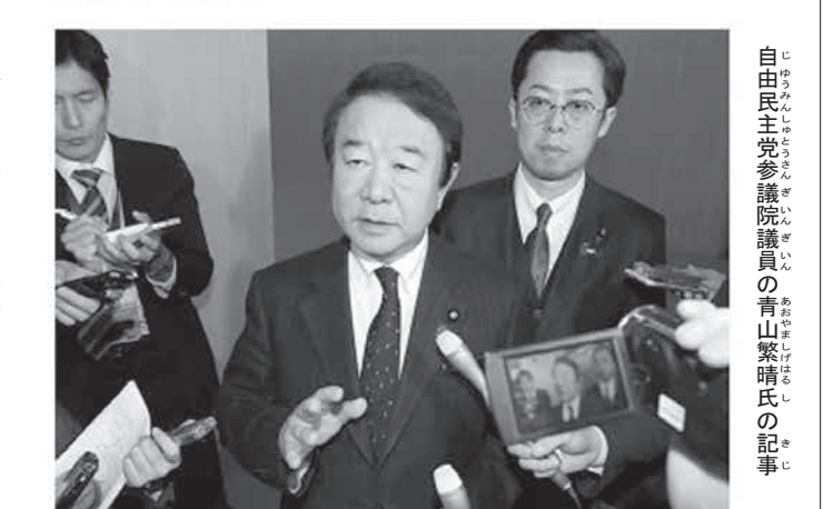
自由民主党参議院議員の青山繁晴氏の記者会見の様子。

ニッポン放送「飯田浩司のOK! Cozy up!」(6月12日放送)に自由民主党参議院議員の青山繁晴が出演。新型コロナウイルス対策の2020年第2次補正予算について解説した。