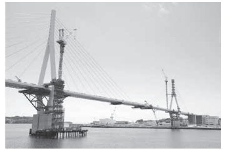
宮城県気仙沼市の気仙沼湾を横断する橋=21日午前

【共同】宮城県気仙沼市の気仙沼湾に架ける橋の建設工事で、最終工程の橋脚をつなげる作業が完了し、記念式典が開かれた。橋は、復興道路として国が整備し、本年度内に全線開通を見込む三陸沿岸道の象徴的存在だ。 国土交通省によると、海上部に架かる橋脚は長さ約680メートルに及ぶ。5月下旬に南北間の橋脚を連結する工程が始まり、高さを調節して溶接。今後はガードレール