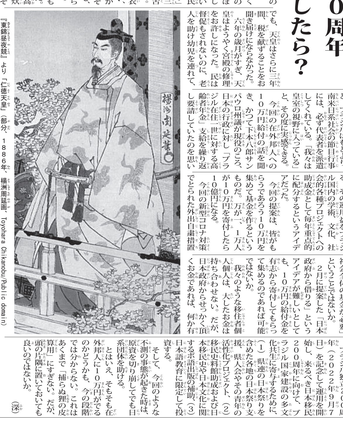
『東鏡屋夜談』より「仁徳天皇」(部分) 1886年、楊洲周延画(Toyohara Chikanobu/Publio domain)

給付金集めて「日伯200周年基金」にしたら？ 海外に10万円給付するかどうかの検討が、政府の緊急経済対策として進められている。海外に10万円給付するかどうかの検討が、政府の緊急経済対策として進められている。 海外に10万円給付するかどうかの検討が、政府の緊急経済対策として進められている。海外に10万円給付するかどうかの検討が、政府の緊急経済対策として進められている。