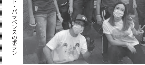
ヤマオさんとプロジェクト・パラバンスのボランティアのメンバー

「ボランティア」に興味がある方は voluntaria@projetoapara.org.br まで連絡を。