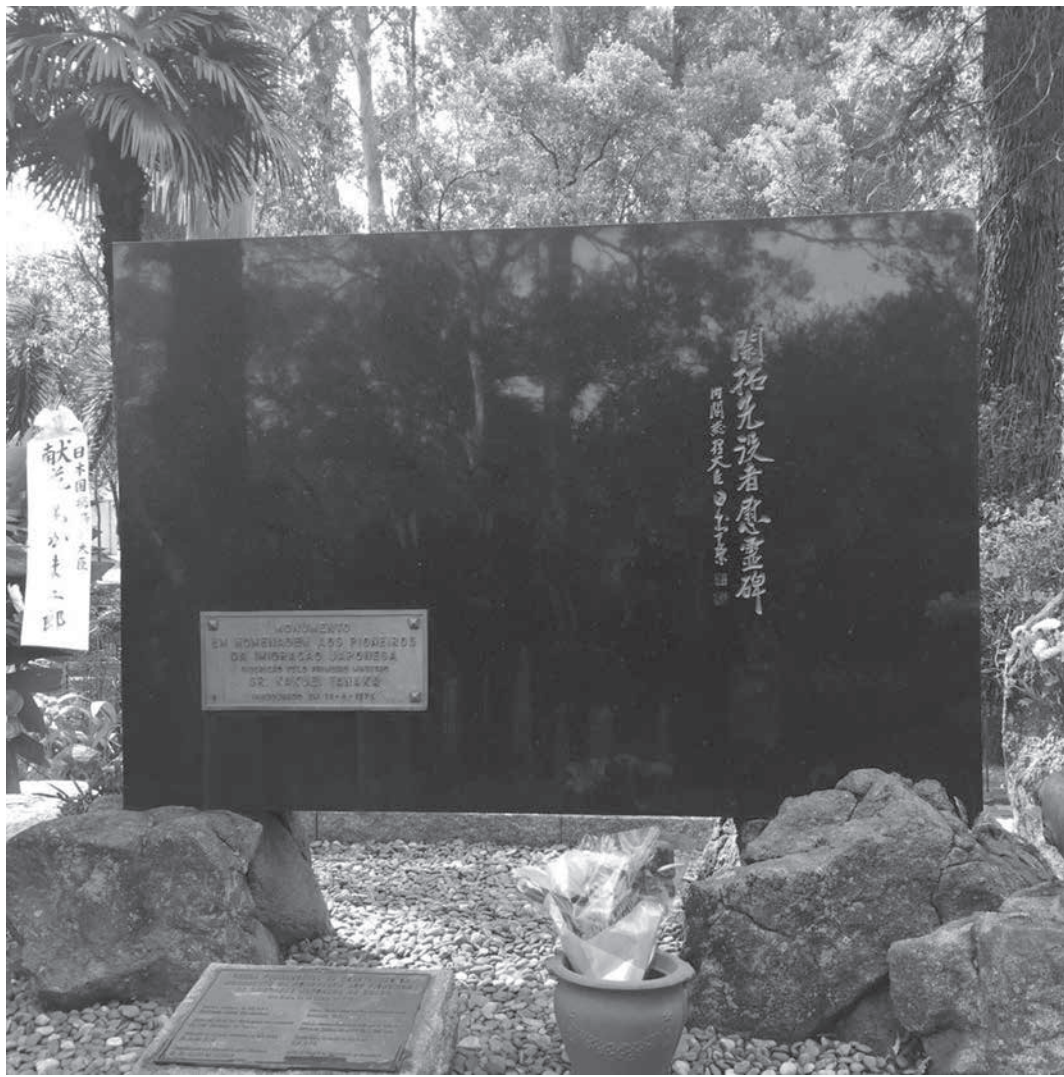
慰霊碑：ブラジル日本移民開拓先没者慰霊碑

去る6月18日はブラジル日本移民の日でした。112周年を記念して様々な記念行事がオンラインで行われました。これらの中でも、ブラジル仏教連合会が主催し、日本政府や日系社会の主要団体による「ブラジル日本移民開拓先没者追悼法要」を特記したいと思