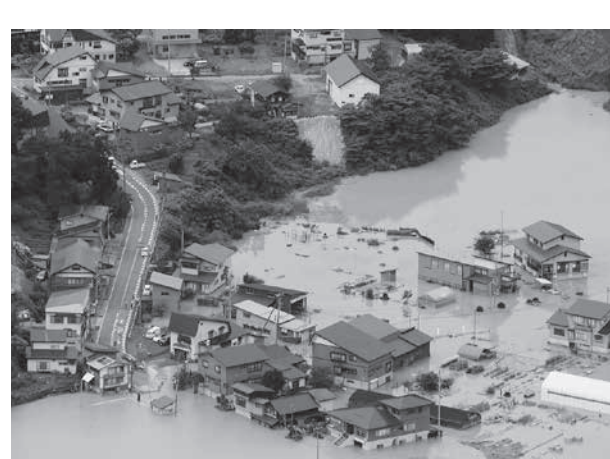
最上川が氾濫し、浸水した山形県大蔵村の住宅=29日午前10時22分(共同通信社機から)(共同)