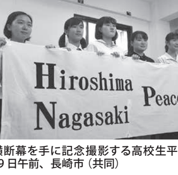
横断幕を手に記念撮影する高校生平和大使=29日午前、長崎市

【共同】広島、長崎両市の市民団体「高校生平和大使派遣委員会」は29日、核兵器廃絶を求め、署名を集めて国連機関に届ける23代目の「高校生平和大使」を発表した。今年度は16都道府県から過去最多の28人を選出。大使は「平和な世界を実現したい」と決意を語った。9月朝時点で少なくとも17棟に被害が出た。【共同】広島市への原爆投下直後に放射性物質を含んだ「黒い雨」を浴びたの、国の援護対象区域外だったことを理由に被爆者健康手帳の交付申請を却下した。原告全員、被爆者と認める。【共同】広島市への原爆投下直後に放射性物質を含んだ「黒い雨」を浴びたの、国の援護対象区域外だったことを理由に被爆者健康手帳の交付申請を却下した。原告全員、被爆者と認める。