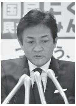
立憲民主と国民分党の合流をめぐり、玉木代表は11日、記者会見し、党本部で開いた臨時執行役員会で、立憲民主との合流への賛

【共同】国民分党の玉木代表は11日、記者会見し、党本部で開いた臨時執行役員会で、立憲民主との合流への賛意を表明した。来週にも両院議員総