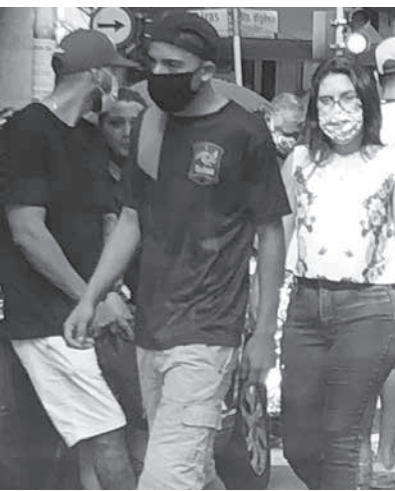
サンパウロ市セントロのサンタエフィジェニャ街の様子

4位のMG州のローズ・ゼマ知事と5位SC州のコマンダンテ・モイゼス知事は大統領支持の知事だが、大統領の所属党・社会自由党(PSL)のモイゼス氏は「コマンダン