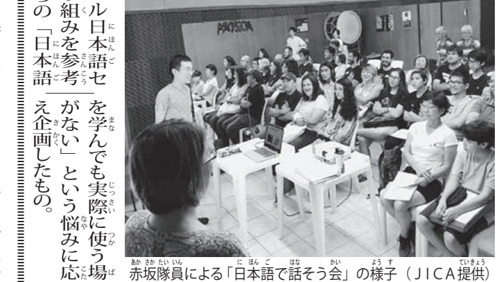
赤坂隊員による「日本語で話そう会」の様子

サンパウロ州ブラガンサ・パウルソンにあるアマゾンアソシエーションの老人福祉施設「厚生ホーム」で作業療法士として活動した。赴任当初から、身体が大きくなり居る者を運ぶ技術に感服した。トイレットの介助、手洗いや履物消毒、日本での介助技術や入居者ファーストな手法に感服を示して、同僚が多くの活動をサポートしてくれるようになり、活動が上手に進行し始めた。彼女のサポートのおかげで、認知症に関する講義等、難しい内容の説明もポルトガル語で実施できたとの報告があり、厚生ホームの皆さんへの感謝の言葉で締めくくられた。