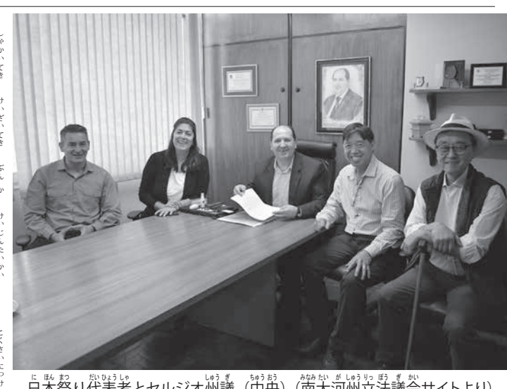
日本代表者とセルジオー州議 (中央)

サンパウロ州ブラガンサ・パウルソンにあるアマゾンアソシエーションの老人福祉施設「厚生ホーム」で作業療法士として活動した。赴任当初から、身体が大きくなり居る者を運ぶ技術に感服した。トイレットの介助、手洗いや履物消毒、日本での介助技術や入居者ファーストな手法に感服を示して、同僚が多くの活動をサポートしてくれるようになり、活動が上手に進行し始めた。彼女のサポートのおかげで、認知症に関する講義等、難しい内容の説明もポルトガル語で実施できたとの報告があり、厚生ホームの皆さんへの感謝の言葉で締めくくられた。