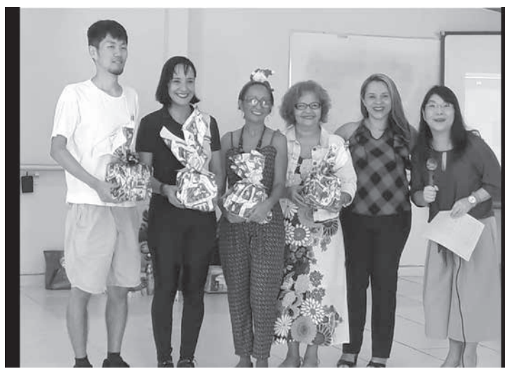
谷隊員とアマゾンアソシエーションの同僚の皆さん