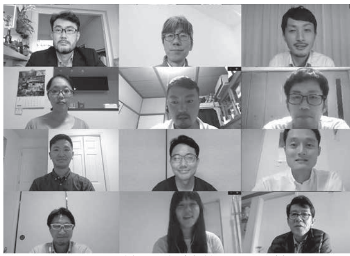
オンラインで行われた最終報告会