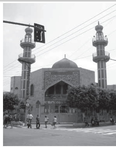
サンパウロのブラズ地区にあるメスキータ