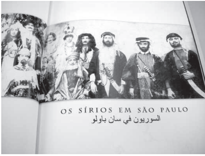
オスマントルコ時代にサンパウロに移住したシリア人に関する本

ブラジル東京海上は安心と安全の提供を通じて、豊かで快適な社会生活と経済の発展に貢献します。