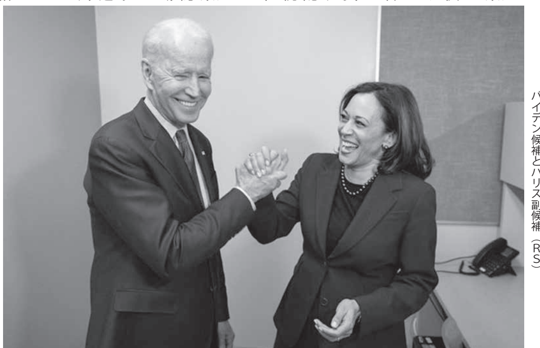
バイデン候補とハリス副候補 (RS)

トランプは再選されると、米国の世界からの撤退や影響力の引き揚げが加速する。軍産複合体の力はますます低下する。中国敵視が続き、敵視される中国が米国への対抗心を強めて台頭する。2期目のトランプはNAFTAの解体もしくは離脱、日韓からの撤退もやろうとした。北朝鮮は韓国に任せ、米朝交渉が好きなうえ、米朝交渉の自滅と共産主義的な中国ロシアの台頭を引き起こしている。トランプを左派がこっそり支援するのは全く自然だ。