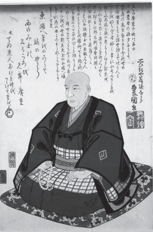
歌川広重 (Utagawa Kunisada / CCO)

江戸時代の初期、京都の四条河原で出雲阿国のかぶき踊りが上演、人気をよんでいました。やがて阿国の踊りを真似た踊りを見せる芝居小屋がぞくぞくと生まれました。