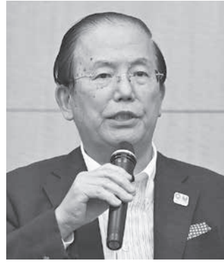
安倍晋三首相が4日午後、東京五輪・パラリンピック対策調整会議の初会合で記者会見し、新型コロナウイルス対策について述べた。

五輪・パラの開催可否を巡って世論が大きく割れている現状を踏まえ、実現可能な対策を国内外に提示できるかが焦点で、開催判断に影響を与える可能性もある。