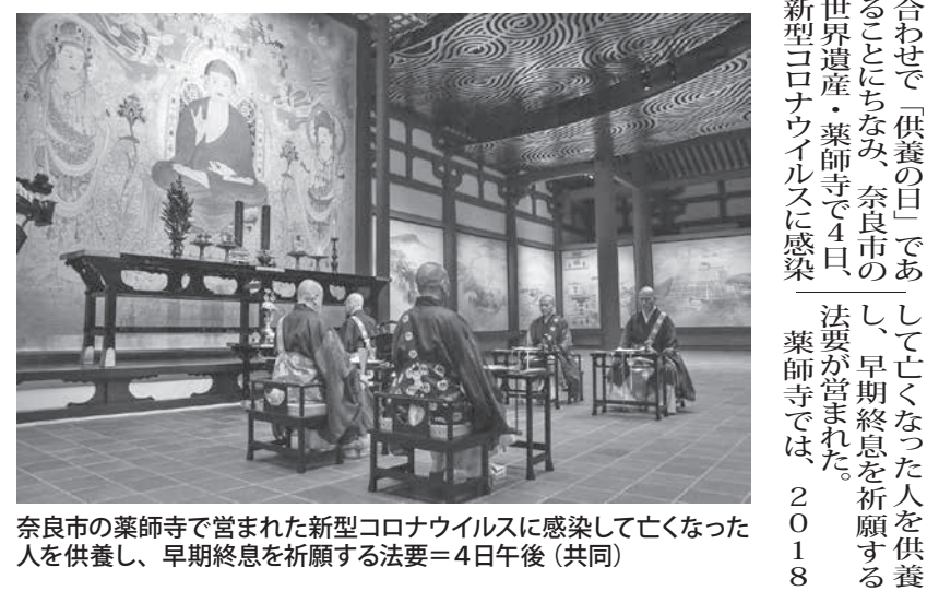
奈良市の薬師寺で営まれた新型コロナウイルスに感染して亡くなった人を供養し、早期終息を祈願する法要＝4日午後

【共同】安倍晋三首相の辞任表明を受け、昭恵夫人は4日（米東部時間3日）、トランプ米大統領のメラニア夫人と電話で会談し、大統領夫妻と良好な関係を構築でき、自身や日米関係にとって大変ありがたいと感謝の気持ちを伝えた。