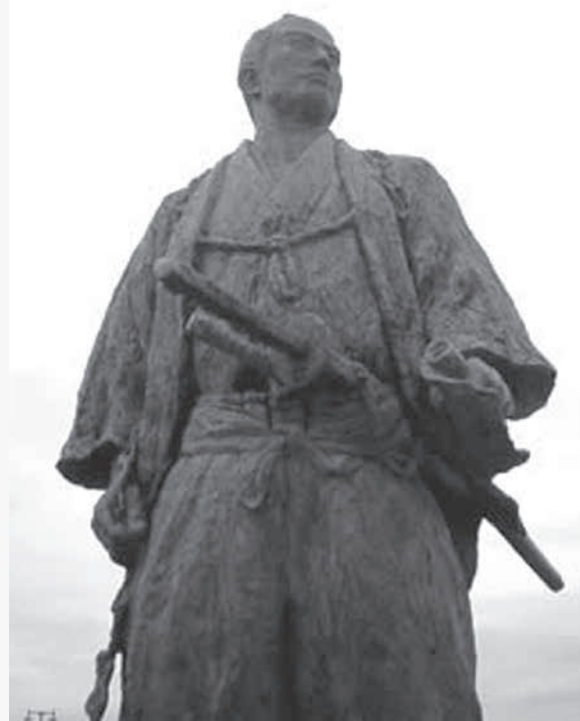
宗谷峠にある間宮林蔵の銅像

1837年、天保の大飢饉で、多くの死者を出した大阪では、陽明学者大塩平八郎(1793-1837)が豪商を襲い、金品を強奪、貧しい人々に分け与えたが、暴動は一日で終わり、大塩は自害した(大塩平八郎の乱)。