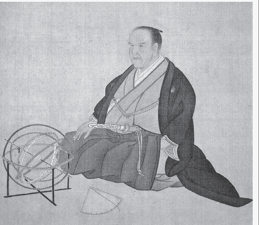
大塩平八郎像 (Kikuchi Yōsai / Public domain)

18世紀の末ごろから、日本列島の海域に欧米諸国の船が出没するようになった。1800年ごろまでに目撃された外国船の数は10隻未満、1840年までの40年間で30隻程度であった。