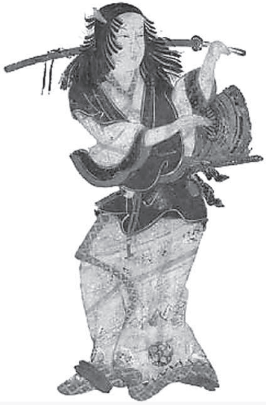
出雲阿国 (Unknown author / Public domain)

江戸時代の初期、京都の四条河原で出雲阿国のかぶき踊りが上演、人気をよんでいました。やがて阿国の踊りを真似た踊りを見せる芝居小屋がぞくぞくと生まれました。