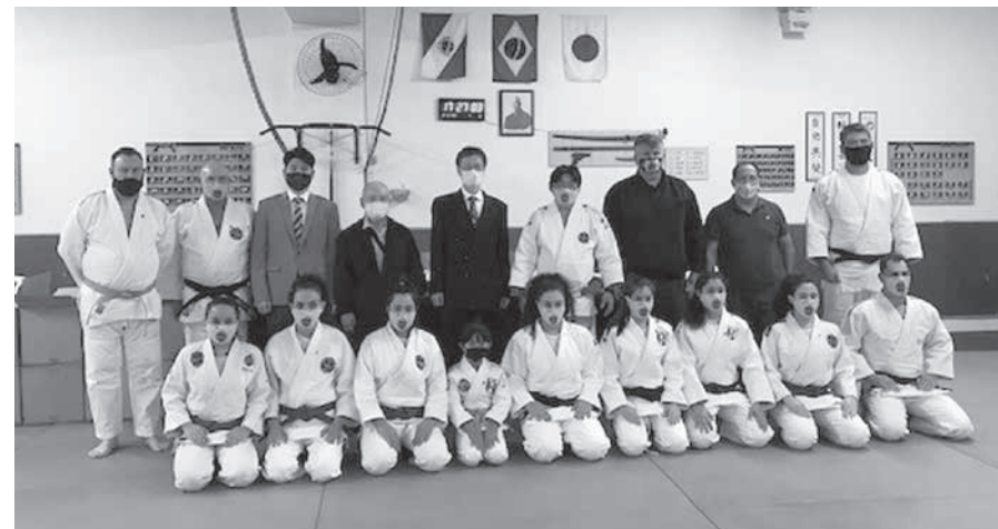
寄贈式の集合写真(後列中央背広姿が高木総領事、その右がイワシタ会長、さらにその右がトラウツアイン局長)

これら用具の必要性は、最後の難関はブラジル側の通関手続きであったが、総領事館が最後までフォローし、コロナの影響で時間はかかったものの、費用も日本からの取り寄せは容易ではなかった。