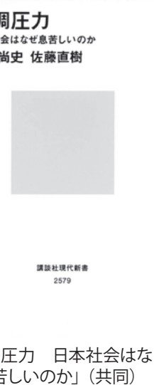
「同調圧力 日本社会はなぜ息苦しいのか」(共同)

「同調圧力」を強く実感する人が多くなったのは、息苦しさを生むもの、正体が分れば、気が楽になる。そして同時に、自分を取り巻く社会の輪郭が、よく見えてくる。(講談社現代新書・924円)