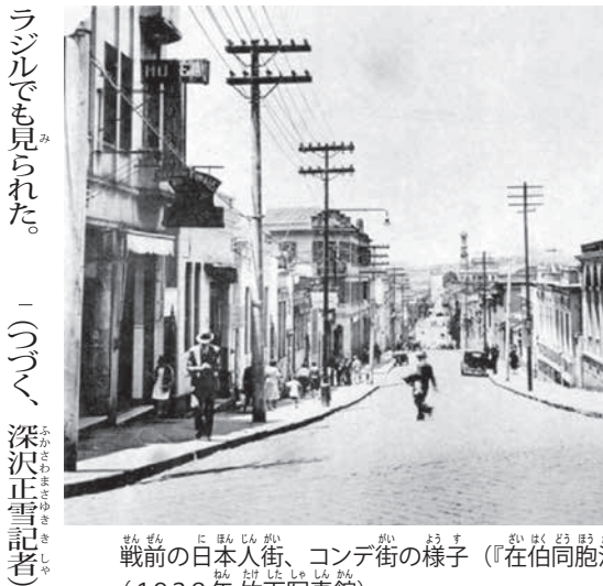
戦前の日本人街、コンデ街の様子(『在伯同胞活動実況写真帳』(1938年)竹下写真館)

「朝陰」490号が刊行 俳誌「朝陰」490号が8月に刊行された。「道問へばマスクを外して客へくれ」(笹谷蘭香)は、今どきの街中の風情をうけいに歌ったもの。「家族のみマスクをかけてサンジ