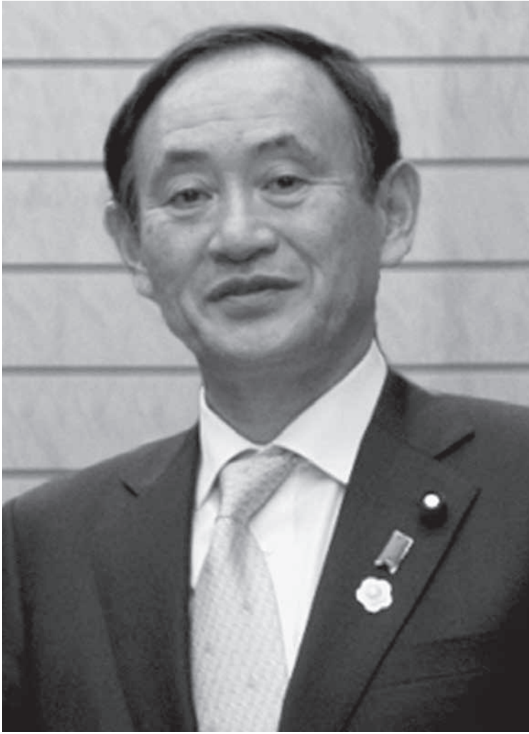
菅義偉第99代総理大臣

安倍首相が引退され、その後継者として菅義偉氏が第99代総理大臣に選ばれた。選挙区は横濱ですが、出身は秋田県南陽市。菅氏は秋田県南陽市出身で、秋田県知事を務めた。菅氏は、秋田県南陽市出身で、秋田県知事を務めた。菅氏は、秋田県南陽市出身で、秋田県知事を務めた。