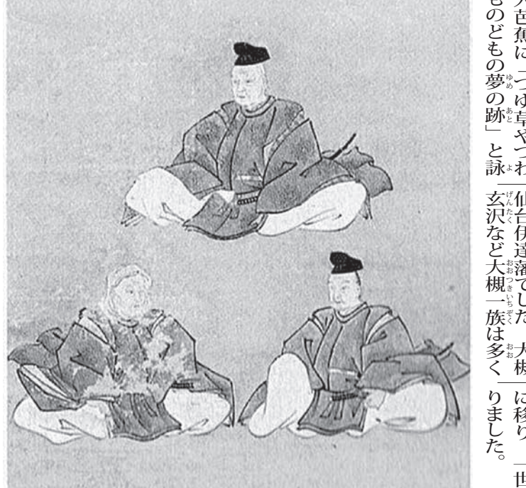
毛越寺一山白王院所蔵の「三衛画像」。奥州藤原氏三代の肖像。上が藤原清衡、向かって右が藤原基衡、左の法体姿が藤原秀衡(江戸時代、毛越寺、/Public domain)

菅首相は「奥州安倍」と自称している。菅首相は「奥州安倍」と自称している。菅首相は「奥州安倍」と自称している。