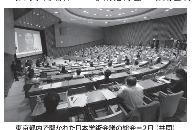
東京都内で開かれた日本学術会議の総会＝2日（共同）

【共同】日米両政府が、2021年度から5年間の在日米軍駐留経費負担（思いやり予算）を決める実務者協議を来週にも開始する。日本側は、11月の米大統領選の結果次第で、21年度予算案を決定する年内での妥結を難しくしている。5年では、1年分の暫定合意を結ぶ案も浮上している。