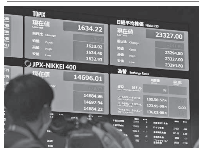
株式全銘柄の売買を再開し、日経平均株価などが表示された東京証券取引所のボード＝2日午前9時、東京・日本橋兜町（共同）

オ米国務長官が来日して6日に行う日米とオーストラリア、インドの4カ国外相会合などの外交日程後に開始する予定だ。日本側は外務、防衛両省の幹部が担当。新型コロナウイルス