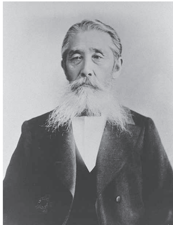
板垣退助