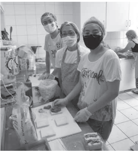
カツサンドを作る皆さん

の災禍前はサロンを貸し出すことで稼いでいたが、コロナで赤字続き。現在、構想中ですが当会も11月に何かの祭りを行おうと考えています。今日以上に盛り上がるよう頑張りたいです」と意気込みを語る。群馬県人会同祭には、群馬県人会