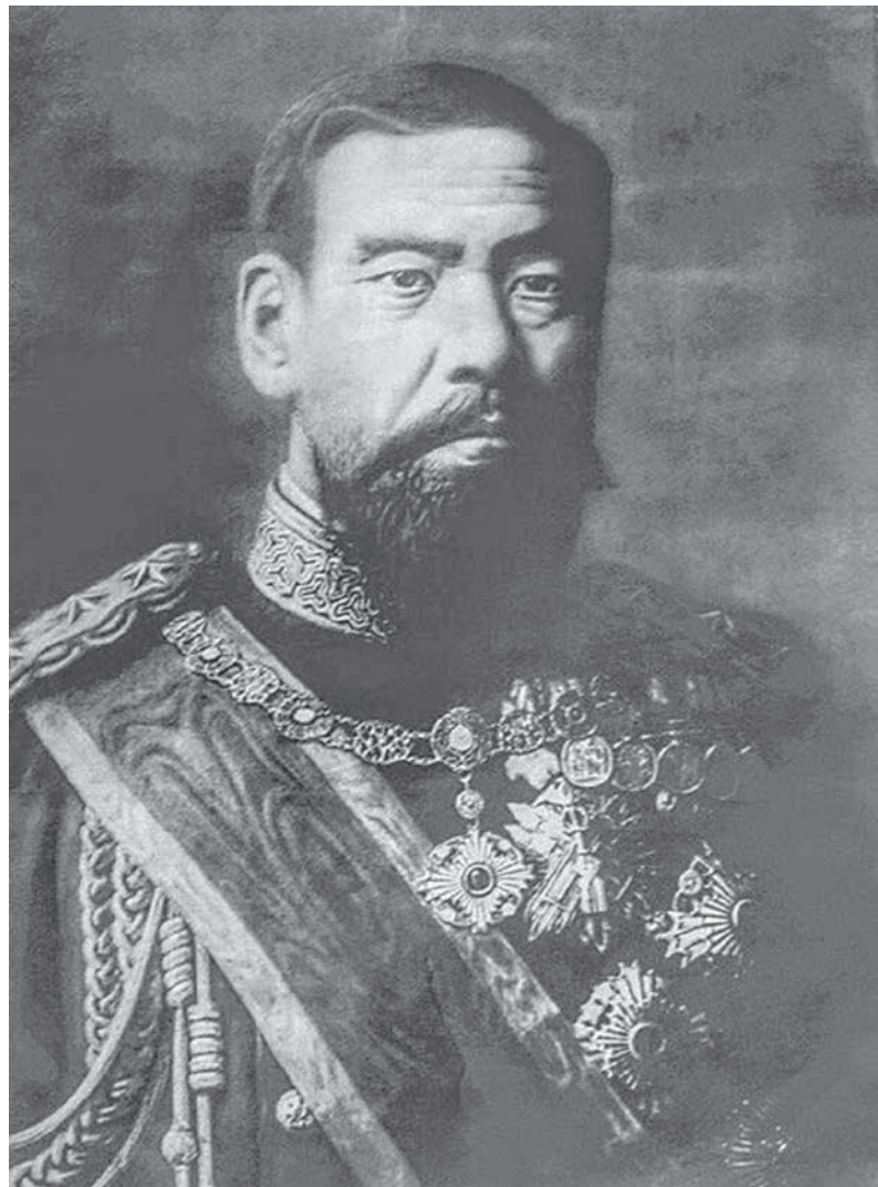
明治天皇 (1890年撮影、高木 背水 / Public domain)