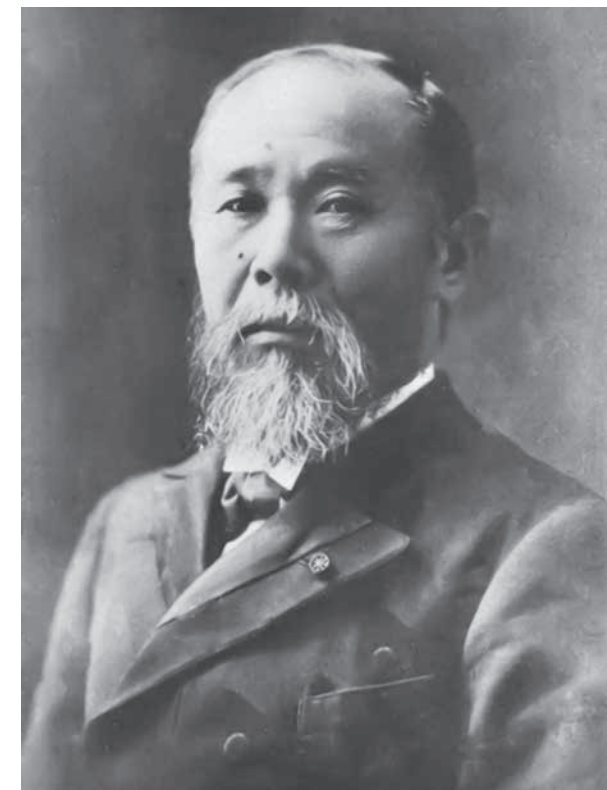
伊藤博文