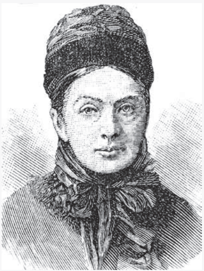
イザベラ・バード (public domain)

ヴィレム・カッテンディーケ (海軍教官) 日本人の欲望は単純で、上流社会の食事といえど簡素、貧乏人らと変わらない。家の中も簡素単純で、日本人の礼儀正しさ、無償の親切、争いのない社会。