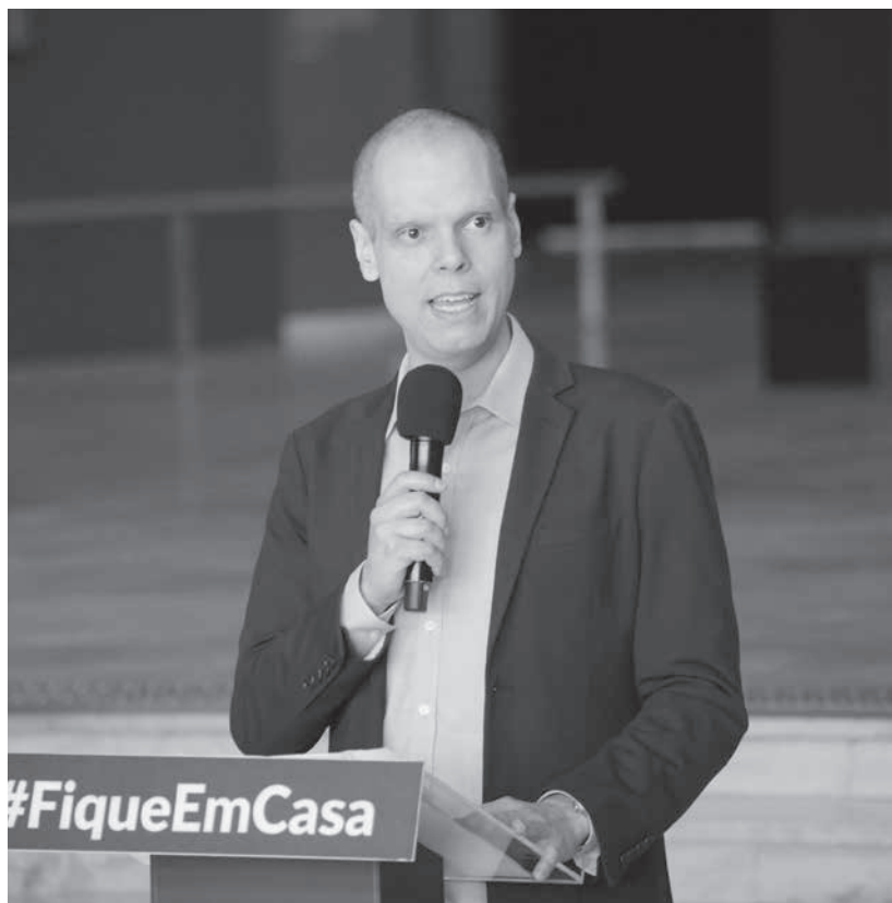
現職のブルーノ・コーヴァス市長 (Governor de Sao Paulo)