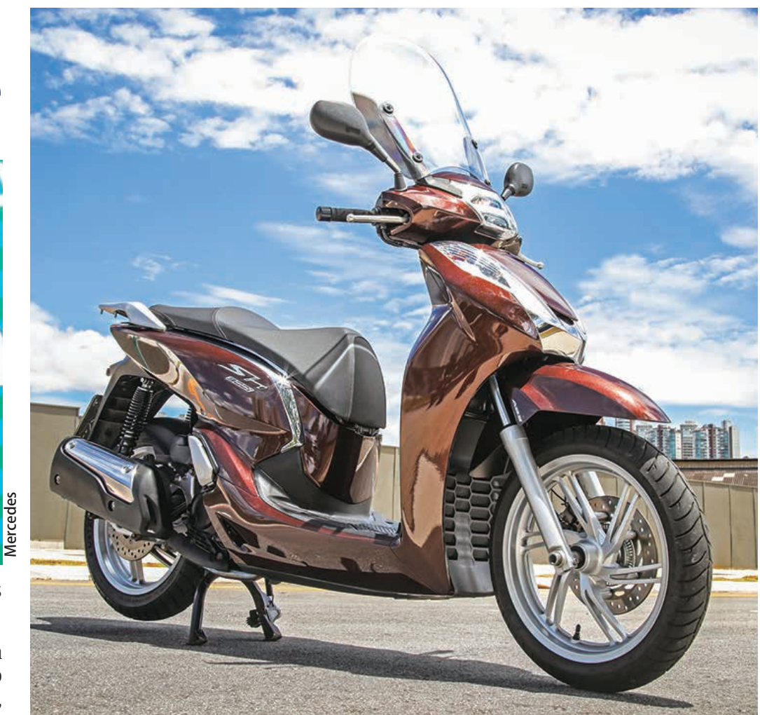
Honda SH 300i.

Neste mês de outubro a scooter poderá ser adquirida com preço promocional de R$ 19.900,00 e 1 ano de seguro grátis. Em nova ação comercial, a Honda Motos e a Seguros Honda apresentam condição especial de compra da SH 300i. A scooter poderá ser adquirida pelo preço público sugerido de R$ 19.900,00 além de um ano de seguro gratuito. A condição é válida em todo o território nacional, até o final do mês (31 de outubro), e será aplicada mediante análise e aprovação do perfil do cliente. "O mercado de scooter vem apresentando um crescimento significativo nos últimos anos e tem sido a porta de entrada de muitos motociclistas no universo das duas rodas, já que as scooters permitem um deslocamento rápido e econômico nas grandes cidades. Já a SH300i, é uma opção interessante também para aqueles que buscam maior potência para viagens com garupa e bagagem, graças a motorização 300cc e itens de segurança e conforto, como os freios ABS e a Smart Key. Esta campanha comercial é mais uma opção que a empresa oferece ao mercado, com a premissa de facilitar a mobilidade para todos", comenta Alexandre Cury, Diretor Comercial da Honda Motos. SH 300i - Completa para todas as distâncias Primeira scooter de 300cc a oferecer a tecnologia Smart Key, que permite ligar a