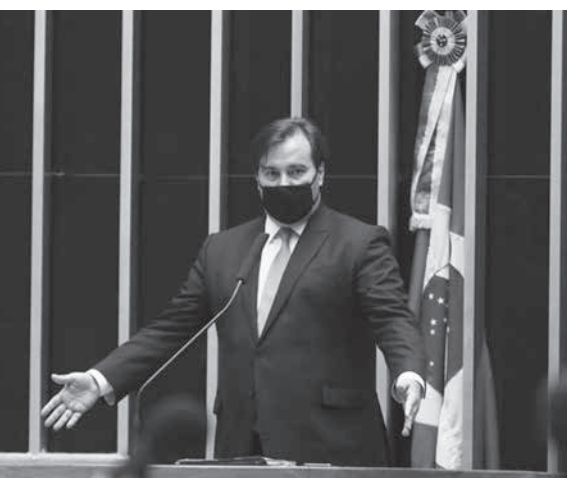
マイア下院議長

マイア下院議長(民主党・DEM)が11日、行政改革は2021年に持ち越されとの見解を示したと同日付フオーリャ紙サイトが報じた。経済省も9月に選挙を理由に諸改革にまつる動きを止めているため、税制改革も来年以降になる見込みだ。