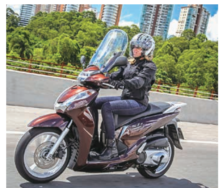
Honda SH 300i oferece a tecnologia Smart Key que permite ligar a moto sem precisar tirar a chave do bolso.

Neste mês de outubro a scooter poderá ser adquirida com preço promocional de R$ 19.900,00 e 1 ano de seguro grátis. Em nova ação comercial, a Honda Motos e a Seguros Honda apresentam condição especial de compra da SH 300i. A scooter poderá ser adquirida pelo preço público sugerido de R$ 19.900,00 além de um ano de seguro gratuito. A condição é válida em todo o território nacional, até o final do mês (31 de outubro), e será aplicada mediante análise e aprovação do perfil do cliente. "O mercado de scooter vem apresentando um crescimento significativo nos últimos anos e tem sido a porta de entrada de muitos motociclistas no universo das duas rodas, já que as scooters permitem um deslocamento rápido e econômico nas grandes cidades. Já a SH300i, é uma opção interessante também para aqueles que buscam maior potência para viagens com garupa e bagagem, graças a motorização 300cc e itens de segurança e conforto, como os freios ABS e a Smart Key. Esta campanha comercial é mais uma opção que a empresa oferece ao mercado, com a premissa de facilitar a mobilidade para todos", comenta Alexandre Cury, Diretor Comercial da Honda Motos. SH 300i - Completa para todas as distâncias Primeira scooter de 300cc a oferecer a tecnologia Smart Key, que permite ligar a