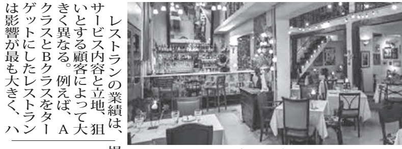
サンパウロのバーの風景

新型コロナウイルスのパンデミックで、長期の閉店を強いられたレストラン業界が回復に苦慮している。ブラジル・バイおよびレストラン協会(Abrase)によると、パンデミック前、国内ではおよそ100万カ所の店舗が営業していたが、その30%が廃業したという。また、9月と10月の業界の売上は、前年同期比40%減程度で推移している。