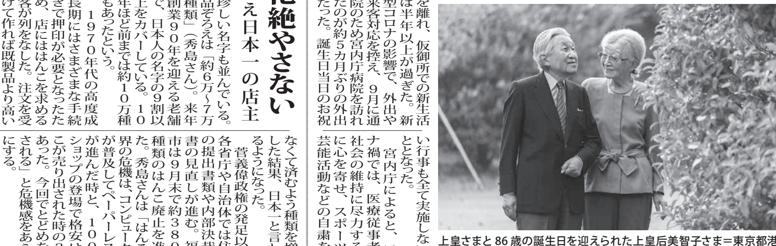
上皇さまと86歳の誕生日を迎えられた上皇后美智子さま=東京都港区の仙洞御所