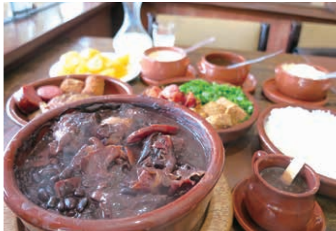
フェイジョアード・トラディショナル