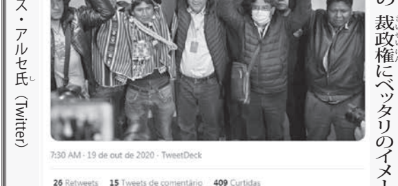
当選したルイス・アルセ氏

「野党側の不満の主張の方がどう見ても有利だ。彼らが冷静に国際世論に訴えれば逆転して政権を持つことも可能だったであろう。だが、ここからひどかった。反エヴォ派の人たちは、エヴォ氏の肉親や繋がり深い政治家の家に火をつけたり、女性市長の髪を