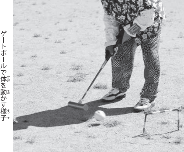
ゲートボールで体を動かす様子