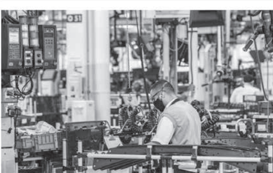
Com a falta de insumos, alguns empresários estão buscando soluções alternativas para continuar produzindo.