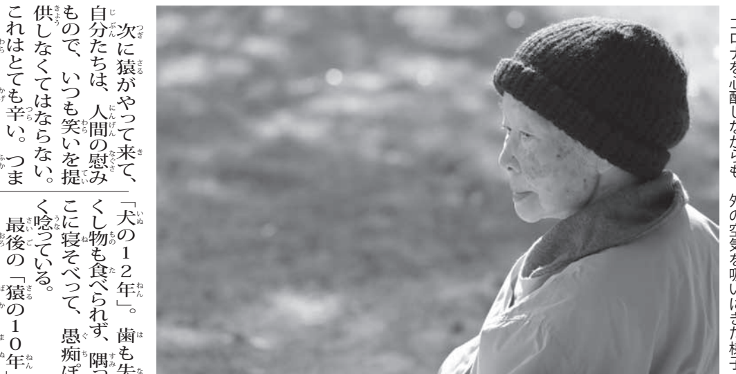
コロナを心配しながらも、外の空気を吸いに来た様子