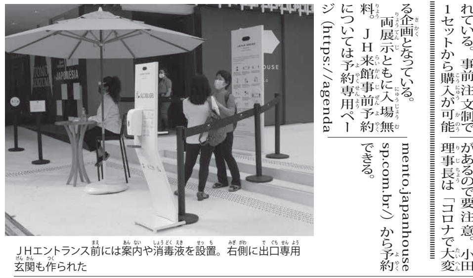
JHエントランス前には案内や消毒液を設置。右側に出口専用玄関も作られた

クルグ館長は「この数ヶ月紙の取材で『この数ヶ月間、JH営業再開の準備のため奔走しました』と再開までの道のりを振り返る。休館の間に始まった日本文化をオンライン発信する取り組み「#JH-SPONLINE」は、今後も続けて行く予定。クルグ館長は「当館はただの一組織ではなく、