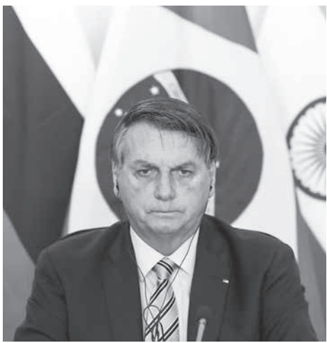
ボルソナロ大統領

BRICSは「新興国」と目される伯国、ロシア、インド、中国、南アフリカの5カ国の総称で、毎年、国際会議を行っている。今年にはコロナウイルスのパンデミックにより、開催地に集合する形はとらず、それぞれの国からネットで行われる。ボルソナロ大統領はこの席で、かねてから批判の的となっていた法定アマゾンやパンタナルで急増している森林伐採問題