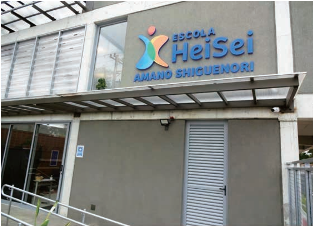
平成学院のロゴと『ESCOLA HEISEI SHIGUENORI AMANO』の看板