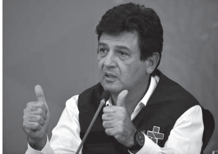
マンデッタ保健相(当時、Marcello Casal Jr./Agência Brasil)

「海外日系人」は「外人」になった日本人と... 「新しい日常への代替案」は「デジタル技術」の導入。