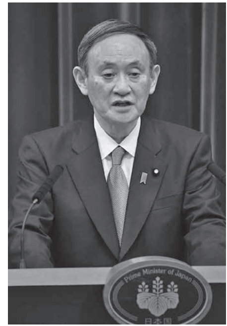
記者会見する菅首相 = 4日午前11時1分、首相官邸