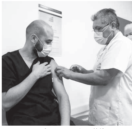
アルゼンチンでのワクチン接種

オックスフォードに輸入許可 コロナバツクは近々登録申請 1月中の新型コロナウイルスのワクチン接種を開始すべく、それぞ