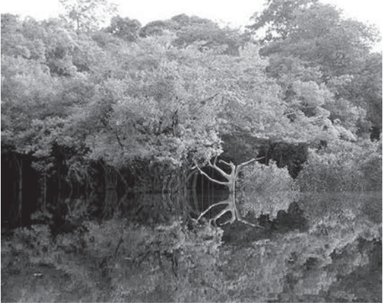
次のパンデミック震源地になるかもしれないアマゾン熱帯雨林の水の中林

年明け早々の7日、ブラジルでのコロナ死者が20万人の大台を超えた。コロンビアが生まれ育った静岡県沼津市の人口がちょうど約19.5万人。それが消滅したぐらいのインパクトだ。 このパンデミック生活の中で西洋社会の風潮「Combat (撲滅する、打ち勝つ)」「Guerra (対ウイルス戦争)」「などの言葉を見れば、違和感を感じてきた。 ウイルスは「戦うべき相手」でも「排除すべきもの」でもない。コロム子(コロンビア)は昨年4月21日付「樹海拡大版」ウイルスと戦うのではなく、共生する生き方」(https://www.nikkeishimbun.jp/2020/200421-column.html)の中で「ウイルスも自然現象の一部であり、それを「撲滅するまで戦う」という考え方自体に、天にツバすような部分を感じる。