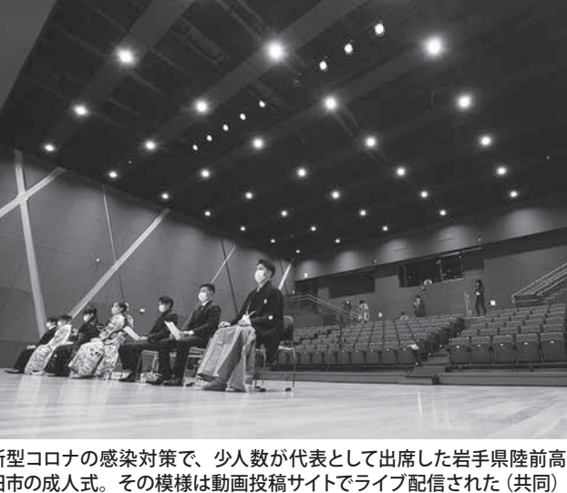
新型コロナウイルスの感染対策で、少人数が代表として出席した岩手県陸前高田市の成人式...