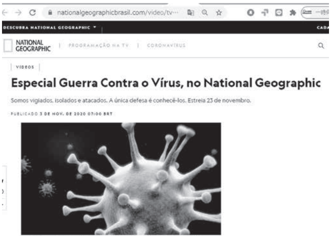
ナショナル・ジオグラフィック誌サイト「対ウイルス戦争特集」

自然の摂理が働いているなら、地震や台風などと同じように自然災害だ。誰も「地震と戦う」とは言わない。「台風を撲滅する」とも言わない。被害を最小化する最大限の準備をして、やり過ごすしかない。 FORBES JAPAN 電子版2020年5月27日付「コロナ危機は「自然界の逆襲」人類がグローバル依存から脱却すべき理由」(https://forbesjapan.com/articles/detail/34716/1/1)