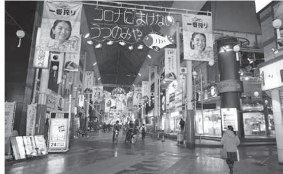
人通りのまばらな東京都中心部の商店街＝13日午後5時52分（共同）

菅首相は「11カ国・地域は中韓のほか、タイ、ベトナム、カンボジア、シンガポール、ブルネイ、マレーシア、ミャンマー、ラオス、台湾」の11カ国・地域を指す。これら11カ国・地域は、これまで例外的に認められていたビジネス関係者の往來を一時停止する。また、これまで例外的に認められていたビジネス関係者の往來を一時停止する。また、これまで例外的に認められていたビジネス関係者の往來を一時停止する。