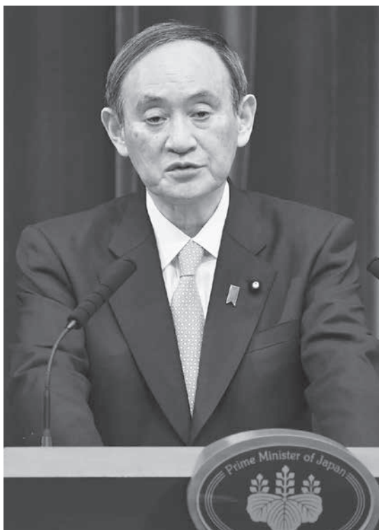
緊急事態宣言に7府県を追加し、記者会見する菅首相＝13日午後7時1分、首相官邸

菅首相は7日の会見で、大阪府などは現時点で発令する状況にはないとの認識を示した。しかし新規感染者数の高止まりが続き、医療提供体制の状況や専門家の意見も踏まえて追加を決めた。