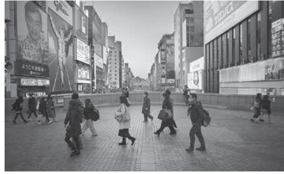
マスク姿の人が行き交う大阪・ミナミの戎橋＝13日午後4時57分