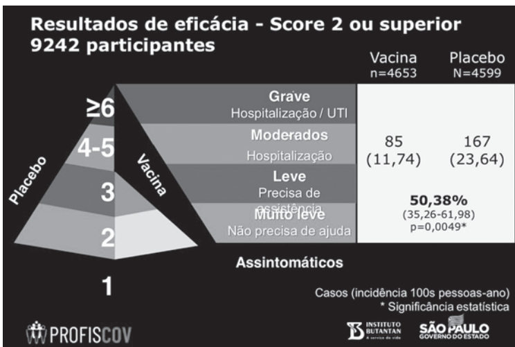
コロナワクチンの効用を示したグラフ (Instituto Butantan)

「接種開始に向けた動きが活発化している」という声も出ている。大統領支持者からは「接種開始に向けた動きが活発化している」という声も出ている。