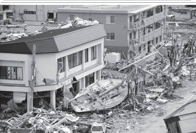
東日本大震災(2011年3月15日)マグニチュード9.0の地震。そこに続く津波後、瓦礫の中にある漁船。