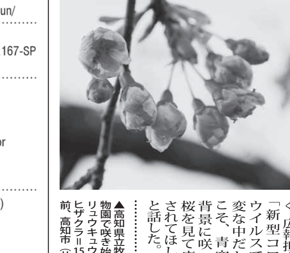
▲高知県立牧野植物園で咲き始めたリュウキユウカンヒザクラ。15日午前、高知市