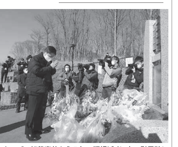
スキーバス転落事故から5年、現場近くに立つ慰霊碑に...