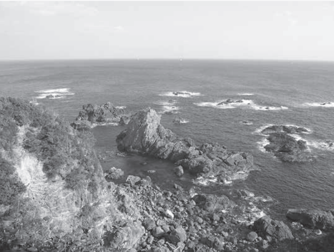
紀伊大島トルコ記念館の直下の海岸。画像中央の岩礁にエルトゥールル号が乗り上げ、座礁した

1890年6月、トルコ(オスマン帝国)の軍艦エルトゥールル号で、650人の親善使節が横浜に到着しました。日本ではこの年、初めて帝国議会が開かれた年で、同じように近代国家をめざしていたトルコは、日本との友好を強く望んでいました。