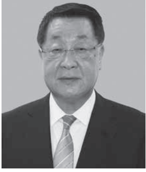
吉川貴盛元農相