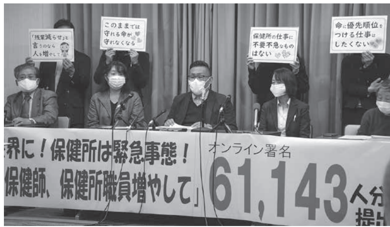
保健所の人員増と機能強化を求める署名約6万1千筆を提出し、記者会...