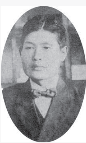
八田與一

1930年、10年がかりの世紀の大事業が完成し、嘉南平野は緑の大地に生まれ変わりました。アメリカの土木学会は、「八田ダム」と名づけ、世界にその偉業を紹介しました。台湾の現地の人々は、今でも八田の命日にはお墓の前で、墓前祭を毎年行っています。