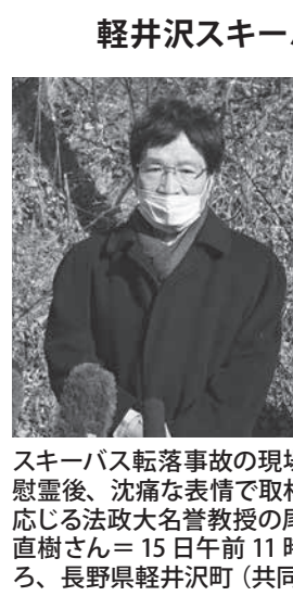
軽井沢スキーバス転落