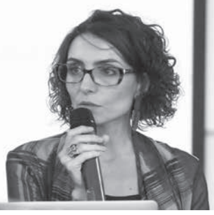
タチアナ・ピシテリ教授

複数の弁護士、並びに租税分野の研究者によると、今回のケースは、解釈をめぐる様々な問題と、長年行われてきた税務当局が実践してきた若無人な振る舞いのエピソードの複合体と見られる。国税庁元局長でコンサルタールのエヴェラウド・マシエル氏は、国税庁が違反行為の訴訟通知書を発行することに足かせのないこと