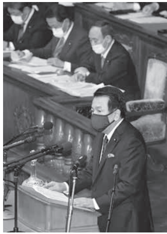
菅首相は20日午後、衆議院本会議で代表質問する。右は立憲民主党の枝野代表。奥は菅首相。(共同)

枝野氏、感染拡大「人災」 代表質問、コロナで論戦 【共同】菅義偉首相は20日の衆院本会議の代表質問で、新型コロナウイルスのワクチン接種を2月下旬までに始めるとの政府方針の前倒しに意欲を示した。「さらに一日も早く開始できるように、あらゆる努力を尽くす」と述べた。立憲民主党の枝野幸男代表は、感染拡大は失政による「人災」だと指摘、緊急事態宣言再発令や法整備の遅れを批判した。感染収束が見えない中、論戦が本格化した。 【共同】菅義偉首相は20日の衆院本会議の代表質問で、新型コロナウイルスのワクチン接種を2月下旬までに始めるとの政府方針の前倒しに意欲を示した。「さらに一日も早く開始できるように、あらゆる努力を尽くす」と述べた。立憲民主党の枝野幸男代表は、感染拡大は失政による「人災」だと指摘、緊急事態宣言再発令や法整備の遅れを批判した。感染収束が見えない中、論戦が本格化した。