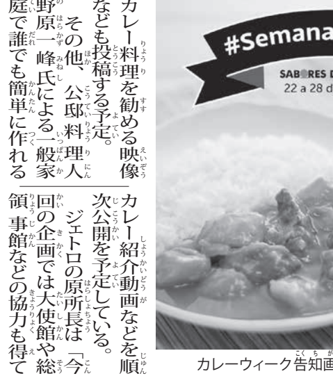
カレーウィーク告知画像

大目小目 JETROイベントには参加していないが、サンパウロにはカレー提供店はまだまだある。リベラルターデから「エスパソン」が日本から輸入した