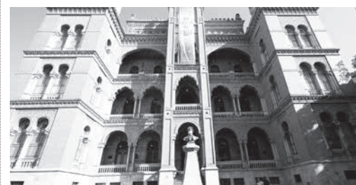
Fiocruzのビル