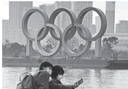
東京・お台場の水上に浮かぶ五輪マークのモニュメント=22日午後(共同)

【共同】政府内では、今年夏の東京五輪・パラリンピックを無観客で開催し、削減を含めて改めるよう要求。補償を優先すべきだとも重ねて訴えた。