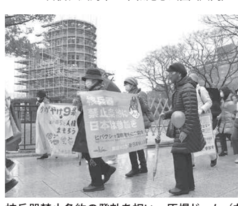
核兵器禁止条約の発効を祝い、原爆ドーム(左)近くを歩いた人たちは=22日午後、広島市

【共同】核兵器禁止条約が発効した。核兵器の開発や保有、使用を全面的に違法化する。