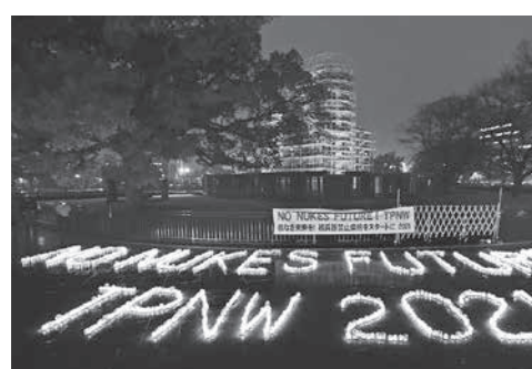
核兵器禁止条約の発効を祝い、キャンドルを並べて作られた「NO NUKES」などの文字。後方は原爆ドーム=22日夜、広島市の平和記念公園

【共同】核兵器禁止条約が発効した。核兵器の開発や保有、使用を全面的に違法化する。