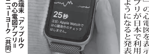
腕時計型端末「アップルウォッチ」の心電図アプリ