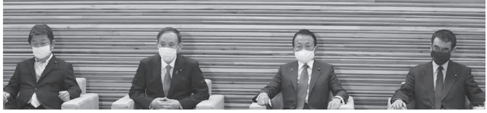
閣議に臨む(左から)茂木外相、菅首相、麻生財務相、河野行革相=22日午前、首相官邸