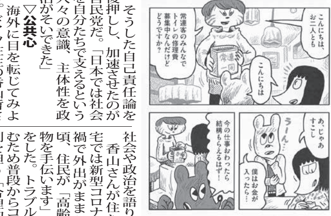
漫画「空のベルリン」(イースト・プレス)より。カフェのトイレの修繕費を集めている常連客が主人と話し掛ける場面(共同)

【ロンドン、パリ共同】飯田康道(永田潤)ユーロ圏経済に明るさの兆しが見えない。新型コロナウイルスの感染拡大は変異型も脅威となり、営業時間などの規制が長期化しているため。経済活動の正常化に不可欠なワクチンも安定供給に不安が生じている。観光といった主要産業の苦境は深刻で、各国は財政出動を繰り出し、下支えに懸命だ。