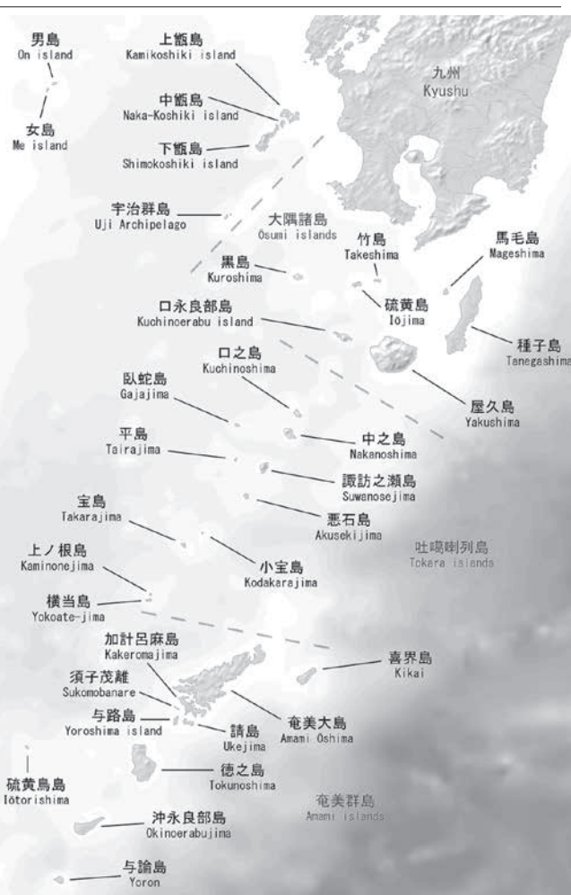
奄美群島(薩南諸島南部)は図の左下角に位置し、その最南端が世論島

別を受けていた。「働けど働けど二向に借金」の減らない与論の人たちの生活風俗の異なる与論の人たちへの人種偏見と差別はひどく、彼らは与論長屋に固まって「ヨロ」と蔑まれていた。改訂された労働条件、本土やマトウンチーによる差別への苦悶、希望を見出し得ぬいらだち、出るは愚痴と溜息ばかりであった。その時、彼らを慰めたのは、やはり唄の「ラッパ節」であったのである(仲宗根幸市著「しまった」を追いかけて) 312頁。