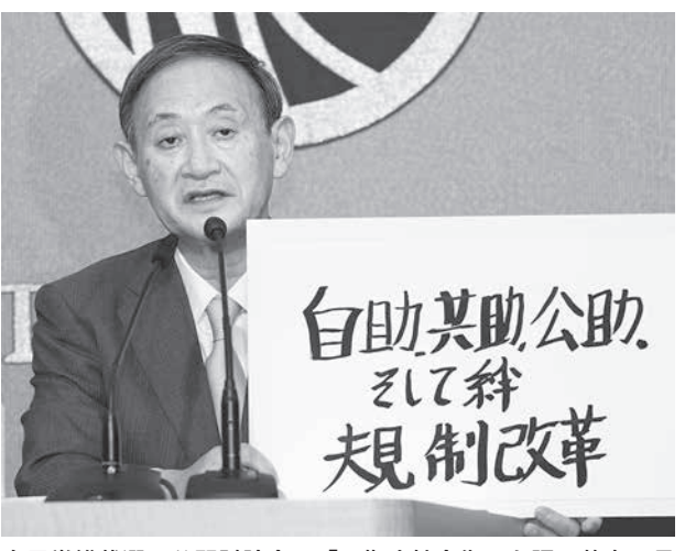
自民党総裁選の公開討論会で「目指す社会像」を語る菅官房長官(当時)

【共同】東日本大震災の際には「絆」が叫ばれ、菅義偉首相は国会で「私」が「目指す社会像」は「自助・共助・公助」として「絆」で助け合う「共助」は必要だ。けれど日本社会は本当にそれを大切にしてきたのだろうか。 「共同」東日本大震災の際には「絆」が叫ばれ、菅義偉首相は国会で「私」が「目指す社会像」は「自助・共助・公助」として「絆」で助け合う「共助」は必要だ。けれど日本社会は本当にそれを大切にしてきたのだろうか。