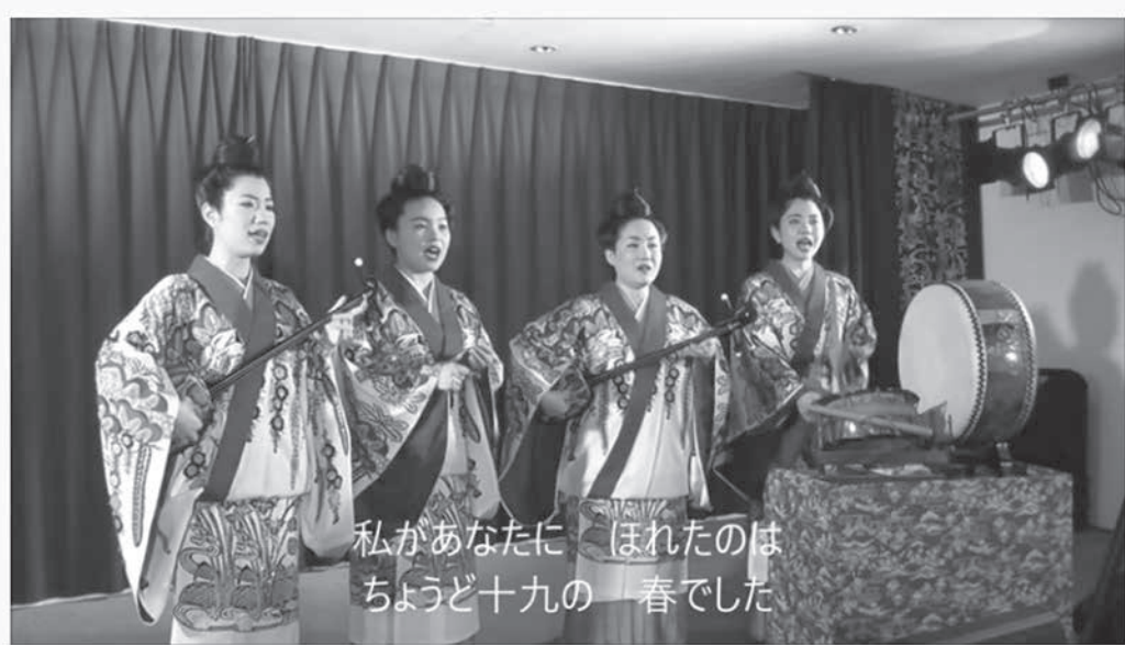
ネーネーズ / 「十九の春」 (沖繩民謡)

1898年(明治31年)8月に与論島は、全戸崩壊という大きな台風に見舞われ甚大な被害を受け、明日の食事も窮する困窮と悪疫の流行にみまわれた。その翌年から数次にわたって千数百の大人たちが職を求めて長崎県口津に石炭運搬労働者として集団移住、いわゆる出稼ぎ労働者となった。当時の日本のエネルギー資源は石炭が中心であり、官営の三池炭鉱が三井物産の手に移り、石炭産業の隆盛を極め、全国から多くの労働者が寄集まっていた。