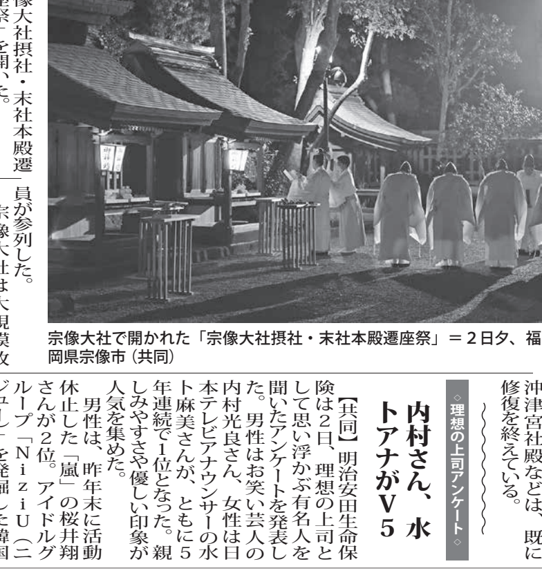
宗像大社で開かれた「宗像大社神社・末社本殿遷座祭」=2日夕、福岡県宗像市