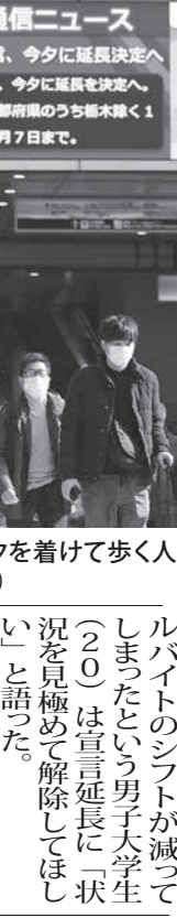
JR大阪駅前をマスクを着けて歩く人々=2日午前

【共同】菅義偉首相は2日、新型コロナウイルス特別措置法に基づく緊急事態宣言について、発令中の10都府県のうち栃木県のみ現行期限の7日で解除し、10都府県は3月7日まで延長すると表明した。