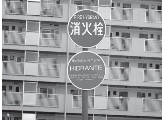
ボルトガル語が併記された保見団地の消火栓標識