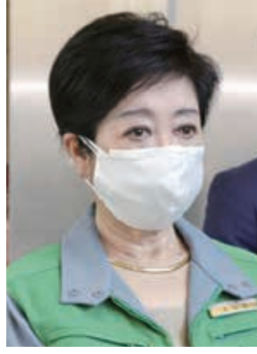
▲報道陣の取材に応じた東京都の小池百合子知事（10日午後、前都庁）

森氏は3日の日本オリンピック委員会（JOC）のバツハ会長らとを交え、17日に開催する案が浮上していた4者会談