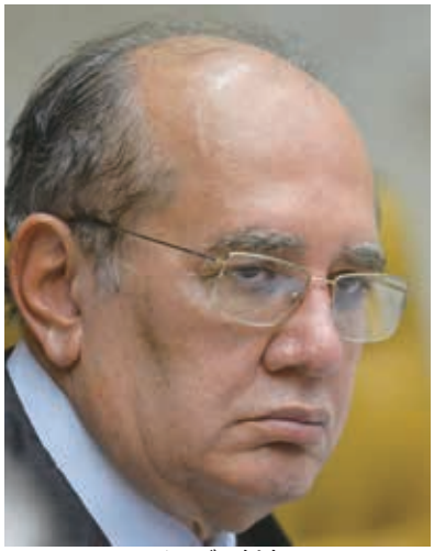
メンデス判事

最高裁第2小法廷は9日、2019年にハッキングされ、「ヴァザ・ジャット」の元となった、セルジオ・モロ元ヴァ・ジャット(LJ)作戦班判事と検察官との対話の内容を、同判事から有罪判決を受けたルーラ大統領が閲覧することを判事投票4対1で認めた。この判決は、国内史上最大級の汚職捜査であるLJ作戦が受けた最大の敗北として注目されている。9、10日付付字紙、サイトが報じている。