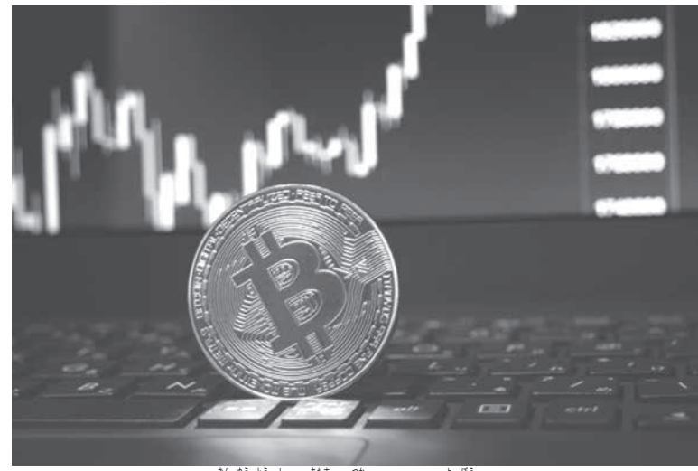
金融投資で頭を使ってボケ予防を

さてボケ予防は、政治界が昨年末の地方選挙と2月早々の下院と上院の議長選の結果をふまえて、2022年大統領選に向けての準備を強化している。年初に感度大と景気鈍化の兆しを示して、経済は政府の新たな緊急支援策の発動を待ち望んでいる。 どのような金融資産がよい利回りを期待できるかを考えるため、いくつかの要件をきちんと整理しておかねばならない。 (1) 国内の主要なリスク 市場が最も警戒しているリスクは財政問題だ。財政健全化は構造改革を要するため、政治動向と政府の国会対策が鍵になる。 (2) 国外の主要なリスク 世界経済の回復は基本的にワクチン接種の普及に依存し、ワクチン接種拡大によるコロナ禍の鎮静に左右される。鎮静が遅れるほど、経済回復が鈍って、ゼロ金利が長引いて弊害が拡散して株価バブル破裂の危険性が高まる。 (3) 2021年マクロ経済の観測 (2月5日付 Focus) GDPの3.47%と鉱工業生産の5.0%成長。IPC A (インフレ)の3.66%、年末にドル相場R$5.01と3.5%のSeiic金利インフレ (12カ月計)は1月の4.56%からドル相場 (2月9日現在R$5.38) も下がる観測だ。 (4) 今年の利回り上位は株式投資 Seiic金利が今の2%からいつ、どの速度で上がり始めるか不透明だが、平均的観測は年末に3.5%であり、年間利回りがIPC A以下で終わることは確実だ。今年におそらく実質利回りマインスを繰り返す。世界的にも株式投資に向かっている。その動きが株価上昇を支え、なおほらく継続しよう。 (5) ドル相場はどうか ブラジルでも金融市場の国際化が進み、欧米の株式などを含めて外貨建て資産を選択できる。金やビットコインにも運用できる。 (6) 頭を使うほど健全性を保てるなら、自分でそれぞれのリスクを検証し、投資先を決めて運用してはどうですか その成果を確認して指数と比較するため、それに必要な指数とデータをきちんと毎日収集することをお勧めする。早急、始めてはどうですか。指数データの収集や整理にパソコンを使いながら、それも頭の体操になります。