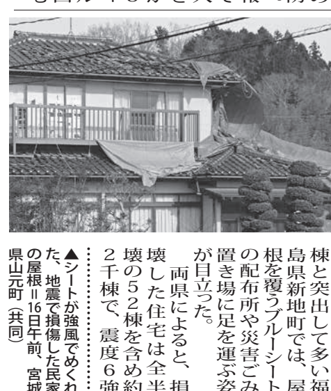
被災地の様子。断水が続く中、住民の生活再建を急ぐ。

【共同】福島、宮城両県で最大震度6強の揺れに見舞われた被災地は16日、雨漏りに悩む被災者も増加。断水が続く中、住民の生活再建を急ぐ。断水の被害が1300世帯に及ぶと見られる。福島県は、被災地の生活再建を急ぐ。