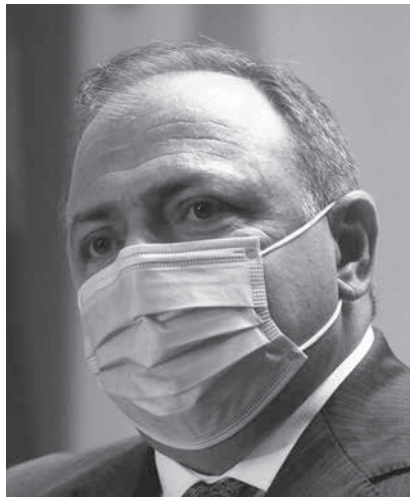
パズエロ保健相

レヴァンドウスキー判事の捜査開始命令は、連邦検察庁からの要請に添ったもので、これによって、パズエロ保健相がマナウスの医療崩壊にどの程度関与し、責任を問われるべきか否かに関する捜査を連邦警察が行うことが可能になった。これにより、保健相が「見解を述べた」として、酸素不足やマスク不足の発生は「不測の事態だった」との見解を述べた。だが、検察庁が依頼していた「保健相とマナウス市保健局長との間のメール」「病院への酸素供給企業、ホワイト・マテルティンズ関係者の証言」「マナウス市への酸素の輸送状況や、マナウス市の病院からブラジル病院サービス公社が運営する