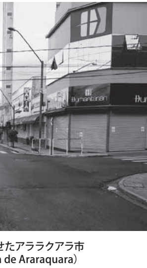
ロックダウンで人気を失ったアララクアラ市

伯国側が中国側に交代を求めたのは、ヤン・ワシントン大使だ。同氏の交代は、アラウージョ外相に乞われた北京伯国大使とボルソナロ大統領の対立を重なる中国批判に対する不満を表明。14日付の付録紙が報じている。