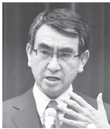
河野太郎行政改革担当相は同日の記者会見で、同意を得た全国の医療従事者4万人が先行接種対象と説明した。

【共同】国内初となる新型コロナウイルス感染症のワクチン接種が17日に始まる。米製大手ファイザー製で、1例目が予定される東京都内の病院に16日午後、搬入された。今回は医療従事者に対する先行接種の位置付け。河野太郎行政改革担当相は同日の記者会見で、同意を得た全国の医療従事者4万人が先行接種対象と説明した。