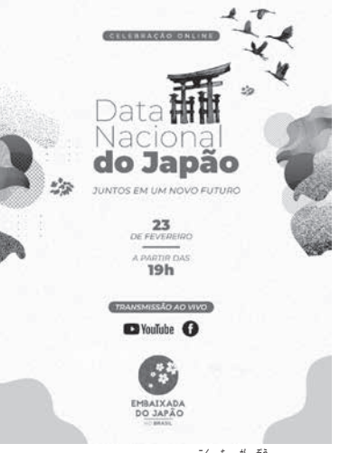
ナショナル・デー告知画像

「新しい未来で会いましょう」(Juntos em um Novo Futuro)のスローガン(山田彰特命全權大使)は23日(火)午後7時から、同館のフェイスブックやYouTubeチャンネルを通じて、天皇誕生日(ナショナル・デー)の祝賀会の動画配信をする。「新しい未来で会いましょう」(Juntos em um Novo Futuro)のスローガン(山田彰特命全權大使)は23日(火)午後7時から、同館のフェイスブックやYouTubeチャンネルを通じて、天皇誕生日(ナショナル・デー)の祝賀会の動画配信をする。