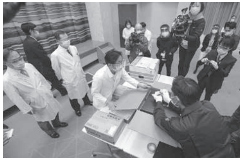
ワクチン接種の準備風景。ファイザー製ワクチンは政府が14日、製造販売を正式承認。最大約38万回分となる第1弾が12日、同社主力工場があるルギーから成田空港に到着した。

ワクチン接種は16歳以上が対象で来週2月までを予定する。英国や米国より2カ月遅れの開始となるほか、副反応への対応や、ファイザーを含む海外3社と契約した量を速やかに確保できるかどうかといった課題がある。ファイザー製ワクチンの第2便は来週日本に到着する見込み。先行接種の後、今年3月中旬以降は、新型コロナウイルス診療に関する医師らに接種に関する医師らに接種を開始する。その後、4月以降に65歳以上の高齢者、さらに基礎疾患がある人などが続く。