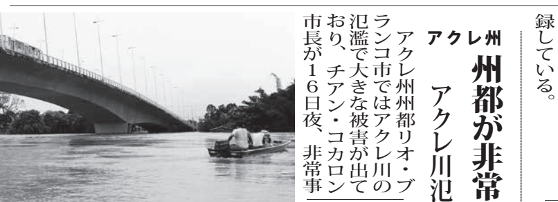
氾濫したアクレ川とボートで移動する人々