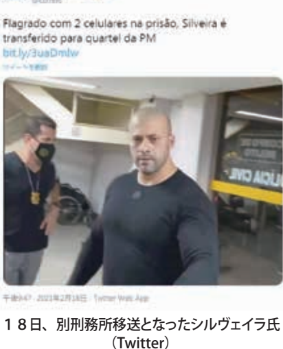
18日、別刑務所移送となったシルヴェイラ氏

シルヴェイラ氏は、17日に最高裁で満場一致で決められた。同氏の場合は下院議員となるには、下院の議長が必要だ。連邦議会の場合、議員に対しては司法よりも同情的な判断が行われることが多い。