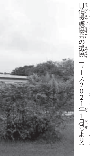
南大河州サブカイア・ド・スール市のクラシキ社 南日伯援護協会の援護ニース2021年1月号より

壊す不届きな企業である、毎日のように各新聞を通して抗議した。遂には、LKBは大規模な密輸業者だと言いつつ輸入の趣旨を十分に理解出来ず、単に競合社に有利な条件を与えまいとする行動であった。