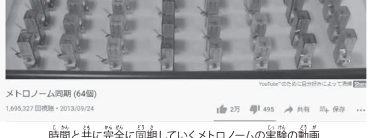
メトロノーム同期 (64周)