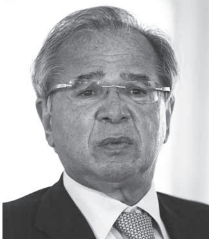
ゲデス経済相