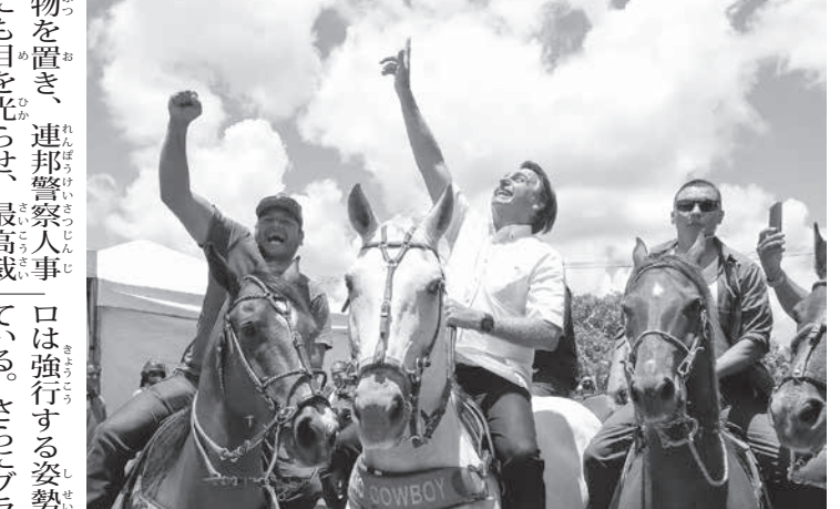
ボルソナロ(中央)は「第4の騎士」か

ボルソナロを、それに喩えている。元法相にして、新型コロナウイルスという疫病を用いて国民に大量死をもたらすボルソナロは死神であり、「ばやく罷免すべきだ」と司法専門家として厳しく論じている。