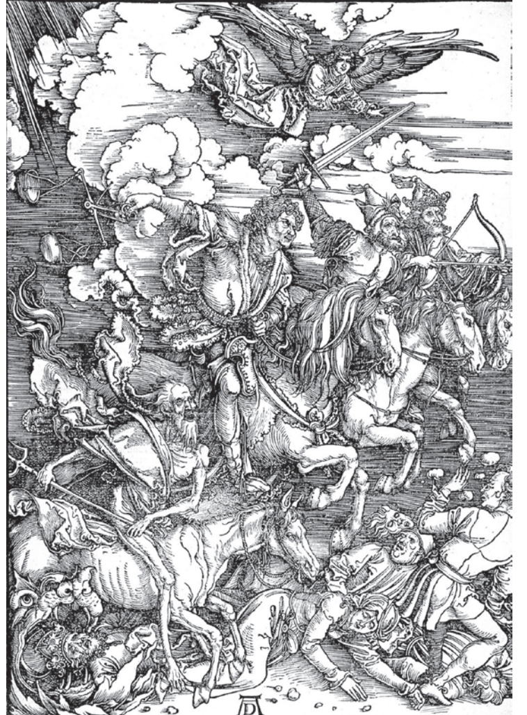
アルブレヒト・デューラーの木版画『黙示録の四騎士』 (Albrecht Dürer, Public domain, via Wikimedia Commons)

「黙示録」の第四の騎士(Quarto cavaleiro do apocalipse)に導かれるのか? この「黙示録」は「新約聖書」の最後に章立てされており、聖書の中で唯一、預言書的人格を持つ部分だ。「黙示録」は、その扱い、解釈と正典への受け入れをめぐって、歴史的に多くの論議を呼び起こしてきた。