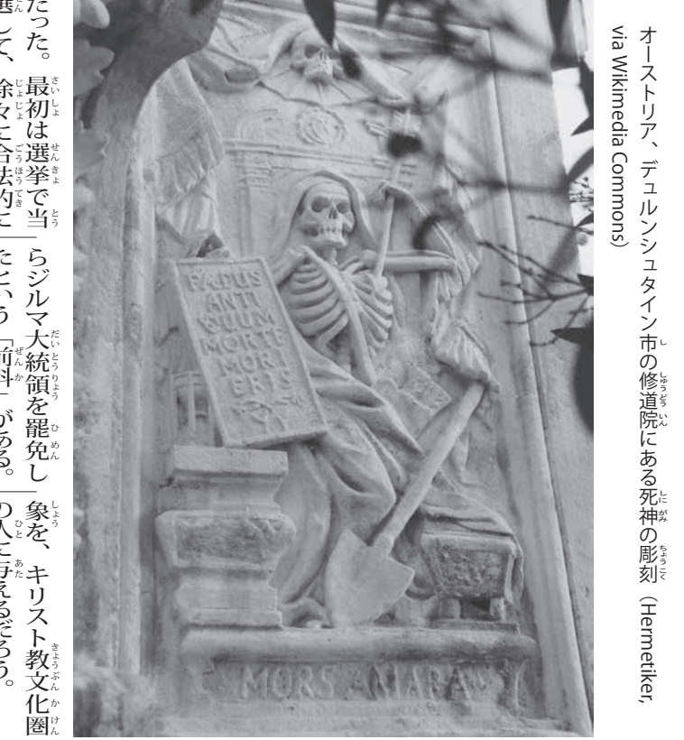
オーストリア、デュルンシュタイン市の修道院にある死神の彫刻

銀行も地方支店を大幅削減して支出を節約する方針を打ち出し、市場から高評価を得ていた。だが、前者にはトランプ運動手組が年初から40%も値上がりした燃焼価格に強硬に抗議し、後者には閉店の憂き目にあった地方都市を支持基盤とするセントロンの政治家が反対し、ボルソナロはそれらの声を選んだ。