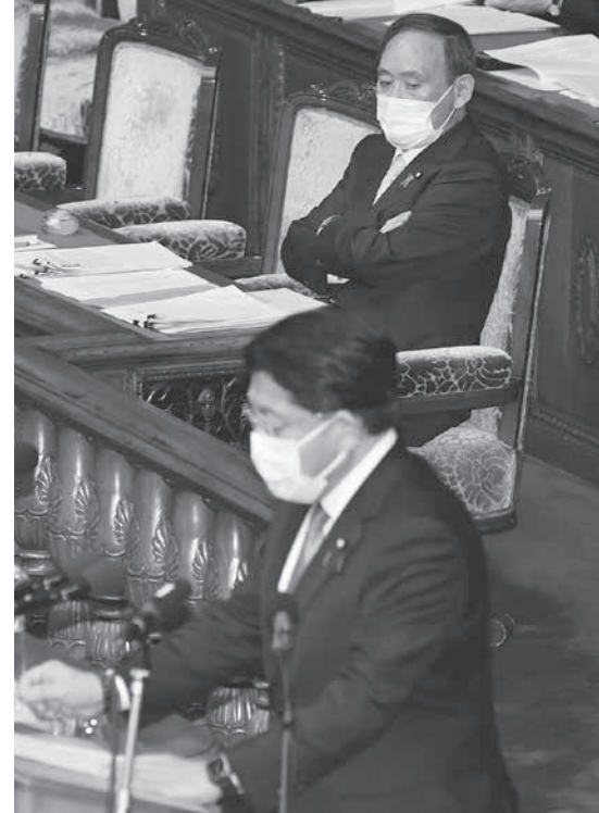
衆院本会議でデジタル改革関連法案の趣旨説明をする菅首相。9日午後

菅政権が看板政策に位置付けるデジタル庁設置を柱とするデジタル改革関連法案が9日、衆院本会議で審議入りし、目指すデジタル社会の在り方を巡って論戦が始まった。菅義偉首相は「誰もが恩恵を最大限受けることができる、世界に遜色ないデジタル社会を実現させる」と意義を強調した。4、5月の大型連休前後に成立させ、改革の司令塔とするデジタル庁の9月創設を目指す。