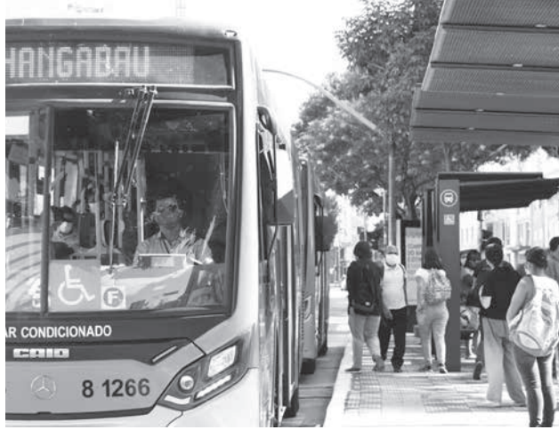
コロナ禍の中でも走るバス

減は、2012年の統計開始以来、2番目に大きな落ち込みとなる。過去最大の落ち込みは、2016年1月の記録した5%だ。また、12カ月間の8.3%減は1月としては最大の落ち込みとなった。サービス業は国内総生産(GDP)の70%を占めており、GDP全体への影響が大きい。昨年同月比で7.8%増と、それ以外のサービス業3.2%減となつて