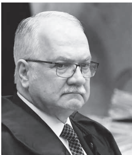
ファキン判事

8日にファキン判事が無効にしたルーラ氏の裁判は、聖州グアラジャールの高級三層住宅を媒介とした取組と資金洗浄容疑、聖州アチバリアの別荘の改築を介した資金洗浄と取組の容疑。そして、ルーラ研究所設立に関する2件の取組容疑の計4件だ。ルーラ氏は住宅を巡る疑念で2018年1月に2審で有罪となり、フィッシュャ・リンパ法に抵触し