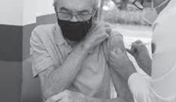
ワクチンを接種する人々

中国が、2020年にラテンアメリカ及びカリブ海諸国に対する融資を一切行わなかった。この地域に対する融資は、2006年以来初めてのこととなる。これにより、複数のアナリストが、中国が慎重な姿勢を示したものと受け止めている。