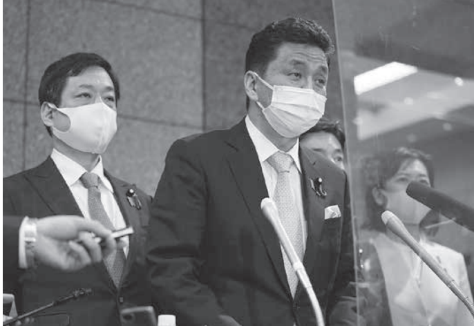
新型コロナウイルス接種センター設置に向けた省内会議後、報道陣の質問に答える岸防衛相（右）と菅首相（左）。