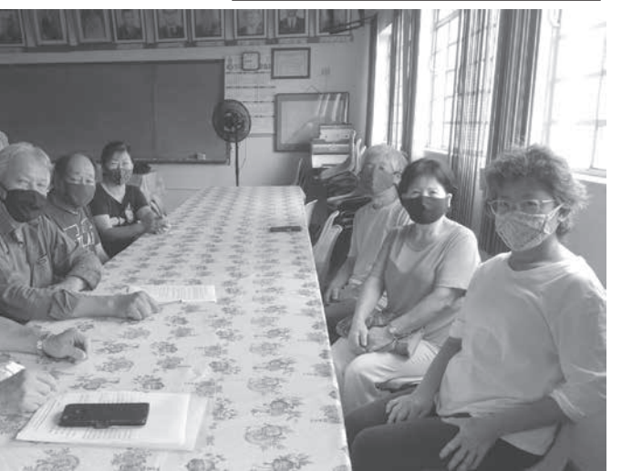
ピラール・ド・スール体育文化協会関係者

同市では非日系人子弟の日本語学校児童や生徒が増加傾向にあり、同プロジェクトにより、日系・非日系に問わず多くの若手の人材が育成されることと期待される。