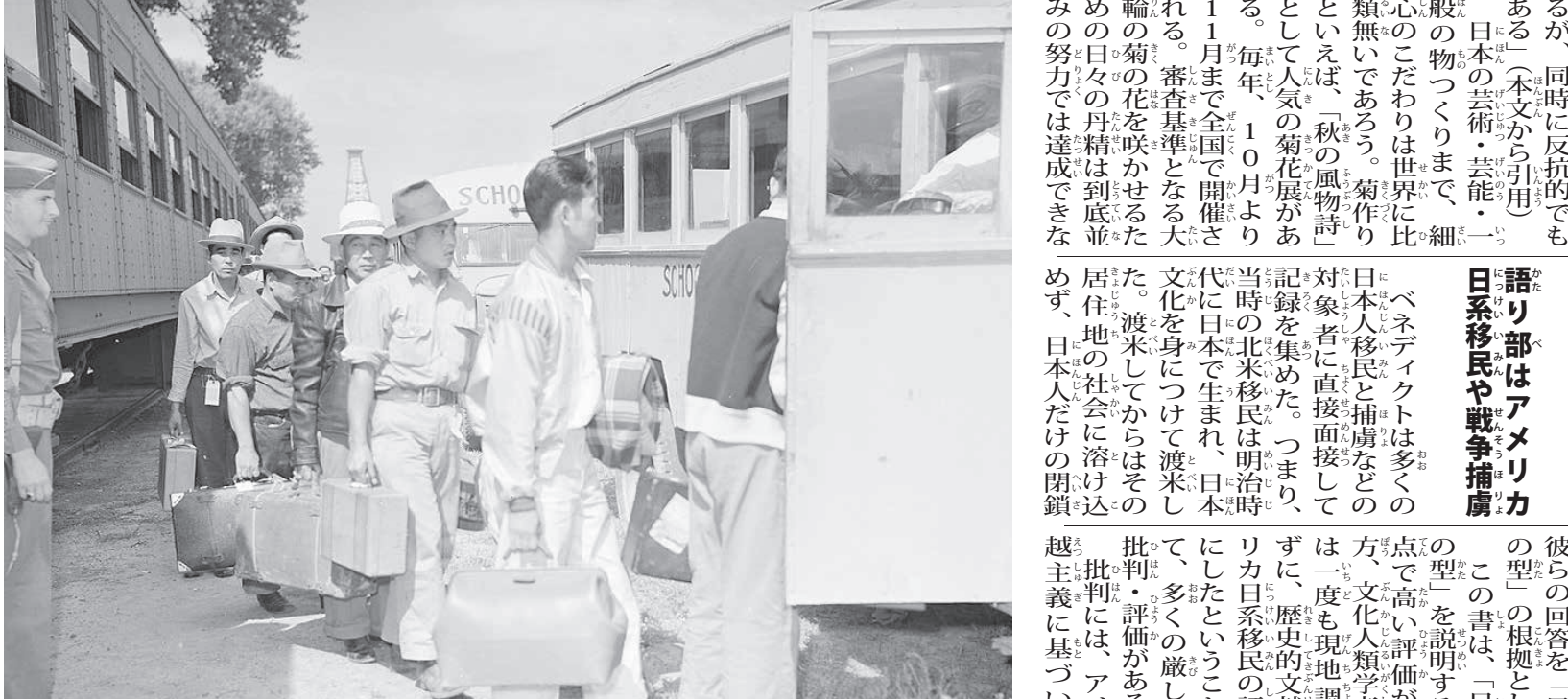
大戦中に強制収容されるアメリカの日本人移民

『菊と刀』が象徴する日本人像。まず、タイトルが非常に印象深い。作者によると、「菊」は国家神道主義における天皇制を象徴している。世の中がどれほど騒々しくても、淡々と菊作りに没頭する人びとを賞賛している。『菊と刀』は、「役者や絵師を敬う美意識、あるいは菊の栽培にあらん限りの工夫を凝らす美的感覚を一般大衆が大事にしてきた」と述べている。