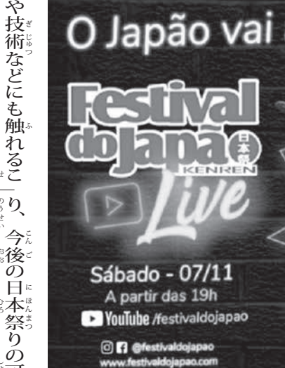
昨年初めてオンライン開催した日本まつりのバナー

また、現在は国の史跡となつているマンザニエリ制収容所跡も訪れ、日系コミュニティが建てた慰霊塔を取り囲み、参加者全員で記念撮影もしました。シエラネバダ山脈を後に控え、一日中、乾燥した、寒くて風の強い人が近づけない場所でした。