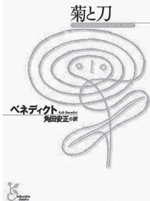
『菊と刀』(ルース・ベネディクト著、角田安正訳、2008年、光文社古典新訳文庫)