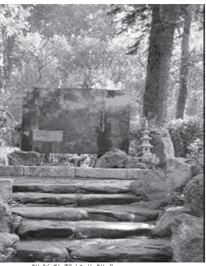
開拓先没者慰霊碑

日本では第2次世界大戦後、海外移住が再開されました。それに伴い、移住者を援助し、家族を呼び寄せるための海外移住家族会が県単位で結成され、1962年、その全国組織の「日本海外移住家族連合会」(略称「家族会」)ができました。