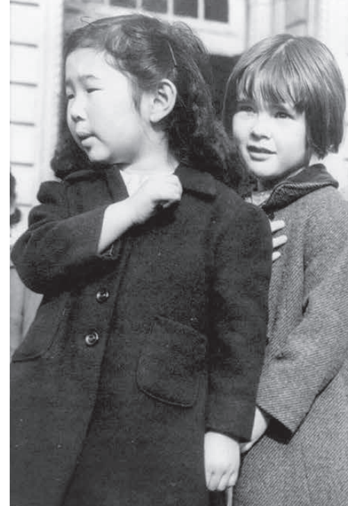
大戦中、強制収容所で合衆国旗への「忠誠の誓い」をする子供たち (1942年4月)

『菊と刀』は、戦時情報局からの依頼で書かれた。日本人の行動パターンを研究し、その文化を説明する。その中で、天皇制を支持している。世の中がどれほど騒々しくても、淡々と菊作りに没頭する人びとを賞賛している。『菊と刀』は、「役者や絵師を敬う美意識、あるいは菊の栽培にあらん限りの工夫を凝らす美的感覚を一般大衆が大事にしてきた」と述べている。