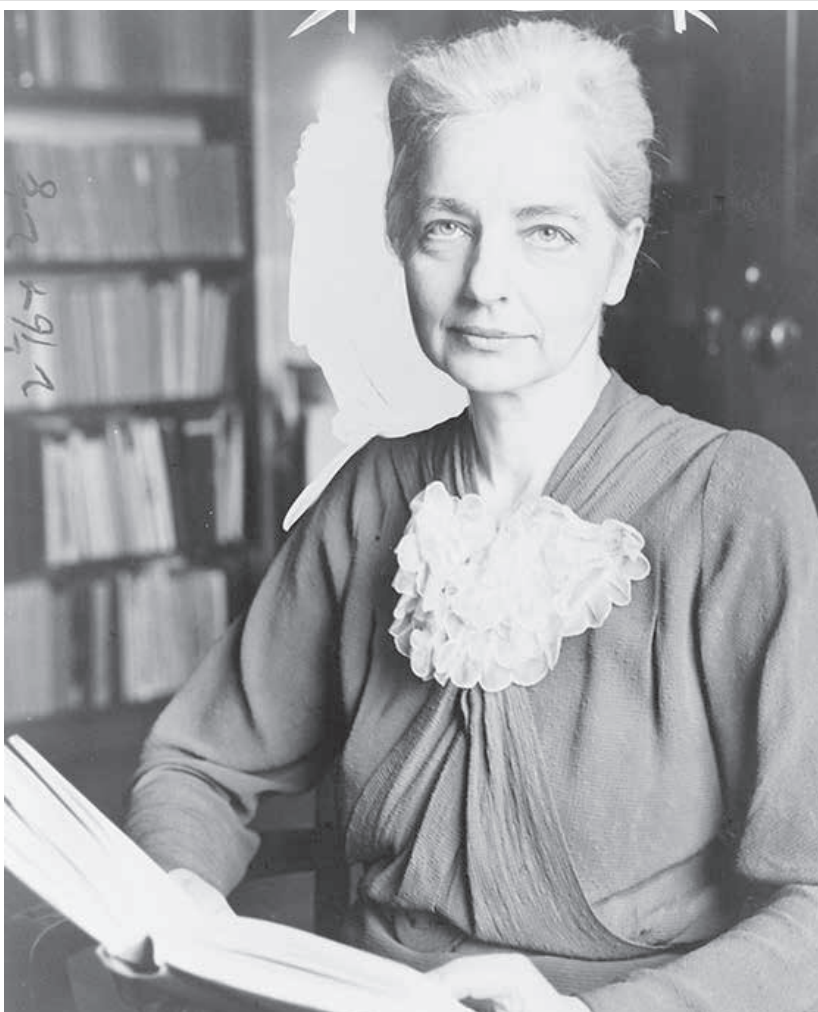
アメリカ人女性の文化人類学者ルース・ベネディクト

ベネディクトは日本語が話せず、文化人類学者でもなかった。手こわい敵と戦うことになった。以前にもあったが、見過ごせない行動と志向の習慣がこれほどいちじく異なつてはいない。『菊と刀』の執筆は、太平洋戦争が終つた後、日本人の行動の意味を理解しないことには対処の仕様がなかった。ベネディクトは、