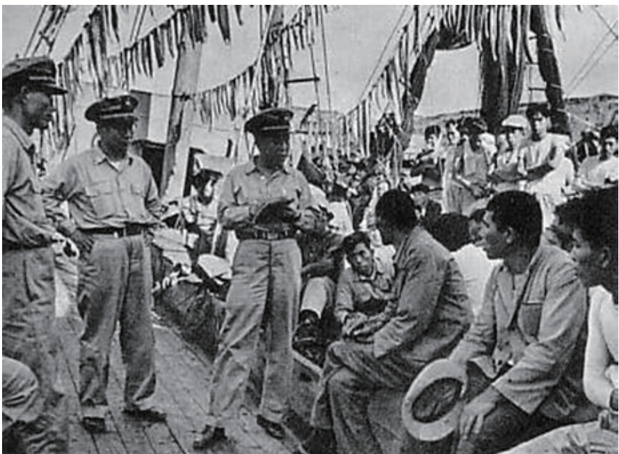
1953年10月、李承晩ラインによる韓国による日本船舶の拿捕

尖閣は盗られた?! 漁船拿捕再来の悪夢... 尖閣は盗られた?! 漁船拿捕再来の悪夢