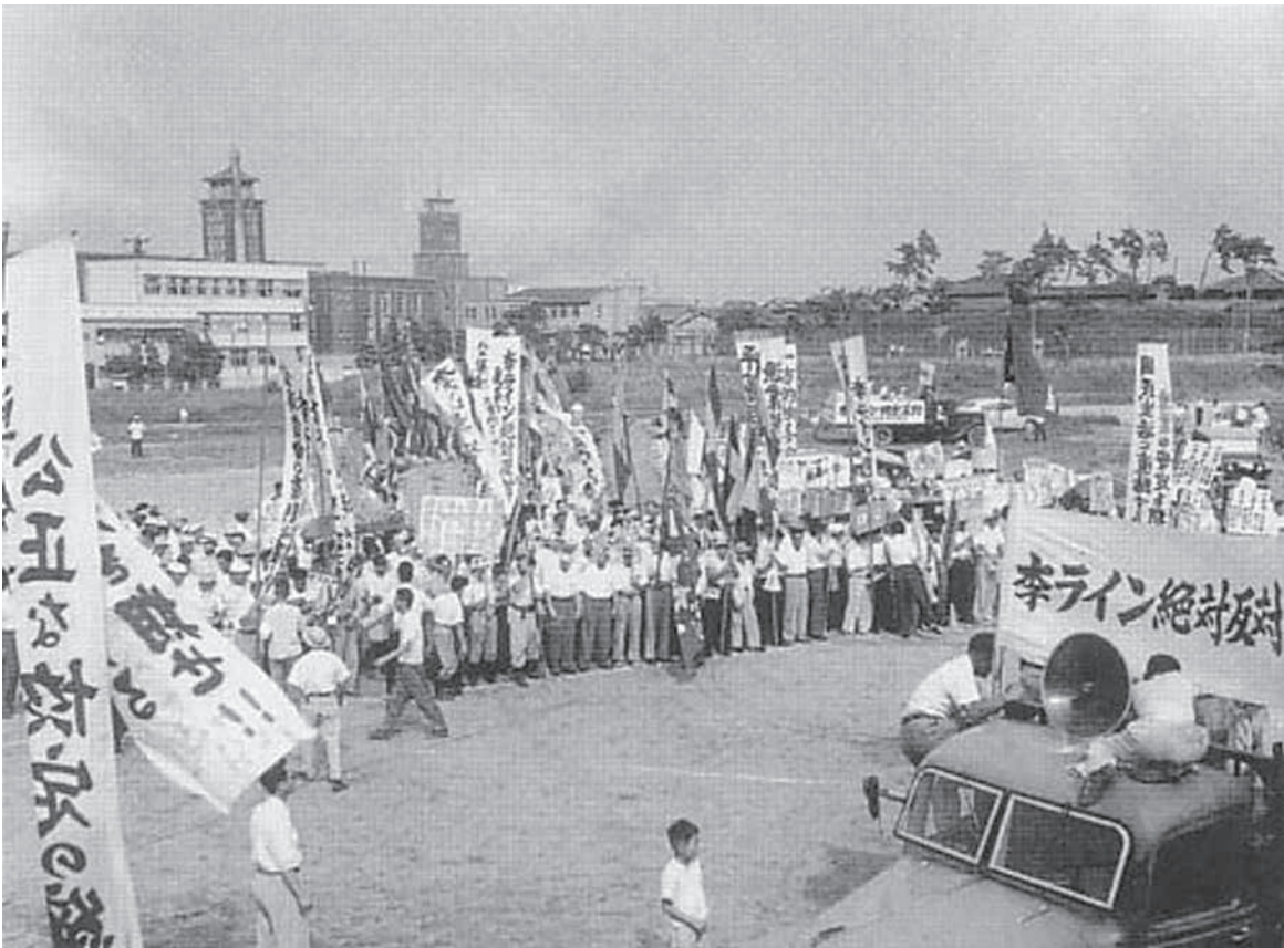
李承晩ライン反対デモ (1953年9月15日)